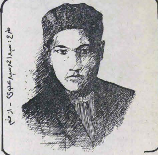
طرح: سید احمد سعید عدوی - از رفیق