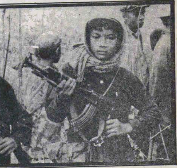
نوجوانان مبارز اریتره

سرمزین اریتره با ۴ میلیون جمعیت در شمال انیوپی و در کنار دریای سرخ واقع شده است و تنها راه کشور انیوپی به دریای سرخ بحساب می‌آید این سرزمین از سال ۱۵۵۷ به تصرف عثمانیان درآمد و بعد به ترتیب مصر، انگلستان، ایتالیا، آمریکا این کشور را