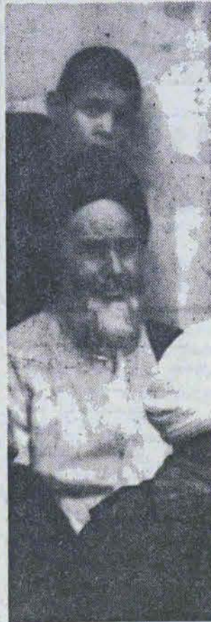
امام، بر فجاجی که دستگاه طاغوتی، در مدرسه فیضیه، پدید آورد، بی‌گردد - ۱۳۴۲