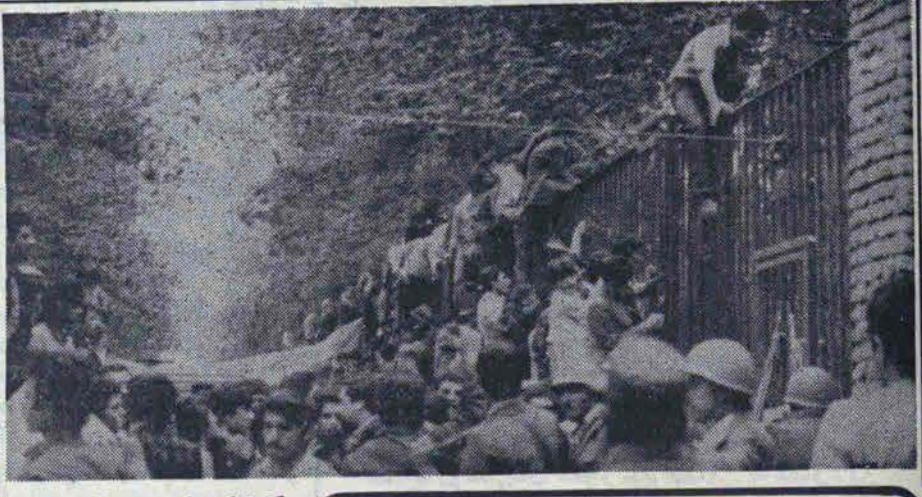
گزارش مر اسام امروز دانشگاه