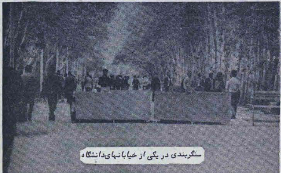
سنگر بندی در یکی از خیابانهای دانشگاه

تهران - خبرگزاری پارس - خبرنگاران خبرگزاری پارس از درگیریهای دانشگاه تهران گزارش دادند ستادهای دانشجویان پیشگام در راه آزادی طبقه کارگر و راه کارگر در دانشگاه تهران دارند و کوششهای مقامات برای تخلیه این ستادها به جایی نرسیده است. صدای تیراندازی لابلقطع بگوش میرسد به گزارش خبرنگار ما از بیمارستان امام خمینی تاکنون ۴۳ مجروح و ۲ کشته به این بیمارستان منتقل شده‌اند که حال چهار نفر از آنها وخیم اعلام شده است. گزارشهای تأیید شده‌ای نیز حکایت از کشته شدن بیست نفر میکند. از او روزان دانشجویان پیشگام نیز تعداد مجروحین ۲۰۰ و تعداد کشته شدگان