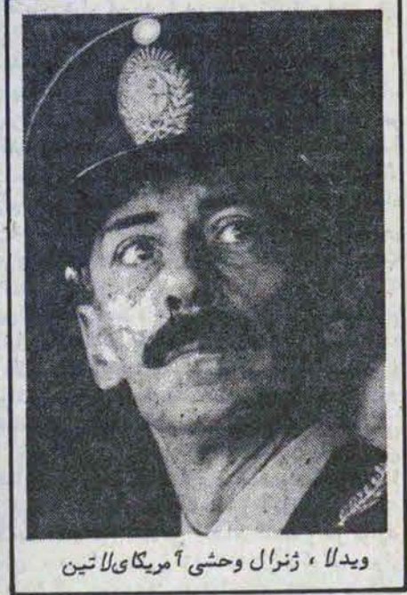
ویدالا، ژنرال وحشی آمریکائی لاتین

بطور خلاصه علیرغم وجود تکنولوژی سبب مدرن طبق معیارهای بین المللی، استاندارد کارائی اقتصادی بعضی افزایش مرتب رو به کاهش نهاد. بحران اورگانیک و تبعه اساسی؛ گرچه قدرت امپریالیسم جهانی در این کشور رو به زوال است ولی تا کنون توانسته‌باشد مکرر در سیستم‌های گوناگون بقای کاذبی برای خود بوجود بیاورد، در این کشورها، ما رادها به خارج فرستاده میشود و در برخی