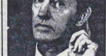
یان اسمیت : گوش بزنک حوادث

اساس مشکلاتی که رودزیا امروز را دربر میگیرد به ترتیب زیر است : ۱ - انگلستان و آمریکا که بنحوی در حکومت ، اقتصاد و تمامی ابعاد سیاسی - نظامی این کشور دخالت دارند و در حال حاضر یک نیروی ۹۰۰۰۰ نفری در اختیار دارند . ۲ - سفید پوستانی که به حمایت کشورهای فوق صاحب املاک وسیع و انحصارات و پاسدار آنها " لرد سومز " فرماندار انگلیس است که سماه پیش به این سمت برگزیده شده است . ۳ - یک گروه سیاه پوست نیز در زیر لوای سفید پوستان و دولت نژاد پرست صاحب امتیازاتی شده و در مقابل جبهه میهنی قرار دارند . مانند " ایل موزروا " و متحدانش . ۴ - این مورد را گرچه فعلاً نمی توان مشکل نامید ولی در نهایت شکل دیگری خواهد یافت . کشورهای خط مقدم جبهه ( تانزانیا - بوتسوانا - زامبیا - موزامبیک و آنگولا ) هستند که گرچه از انتخابات فعلی که قطعا به پیروزی جبهه خواهد انجامید پشتیبانی می کنند ، ولی این را نیز باید پیش بینی کرد که در آینده همین کشورها بر سر تصرف هرمونی ( سلطه طلبی ) رودزیا مسائلی را پیش خواهند آورد . ولی در حال حاضر بزرگترین متحدان جبهه میهن پرستان کنت کائوندا رئیس جمهور زامبیا و ( جولیبوس نیهیره - ره " رئیس جمهور تانزانیا هستند . بهر حال همه چیز بستگی تام به نحوه عملکرد هیئت حاکمه دارد . و آنهم طولی نخواهد کشید و خیلی زود ، مظاهر آن تجلی خواهد کرد .