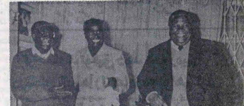
رابرت موگابه ( سمت چپ ) ، کنت کائوندا و جوشوانگومو ( خط مقدم جبهه )