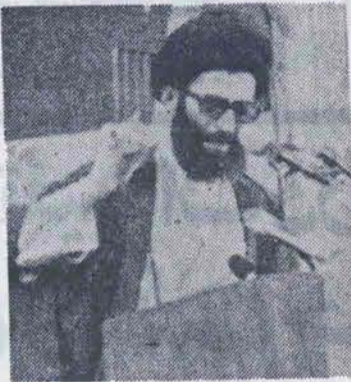
نیز از مهمترین رشته های تحصیلی ایشان بوده و سالها این سه رشته را در حوزه های قم و مشهد تدریس کرده است.

این دستور دیروز از سوی امام خمینی رهبر انقلاب اسلامی ایران در مورد اقامه نماز جمعه در تهران به این شرح صادر شد.