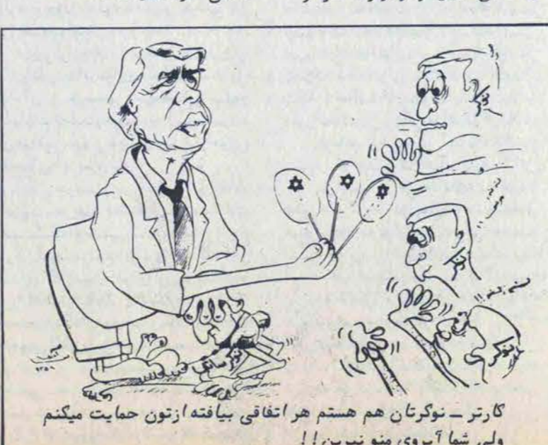
گارت - نوگرتان هم هستیم هر اتفاقی بیافته از تون حمایت میکنم ولی شما آبروی منو نبرین!!

گراگان - خبرگزاری پارس - دادستان کل انقلاب اسلامی استان مازندران از کلیه کشاورزان، کارگران کشاورزی و دیگر افراد ساکن روستا - های شهرستانهای گراگان و گنبد خواست که از تصرف تجاوز بازاری دولتی و ملی و دیگران قویا خود - داری کنند زیرا دخل و تصرف در اراضی دیگران مغایر اصول اسلامی و خلاف قانون و شئون انسانی است و متجاوزین شدیداً مجازات خواهند شد. سید مهدی طباطبائی که در گردهمایی بیش از دوهزار نفر از