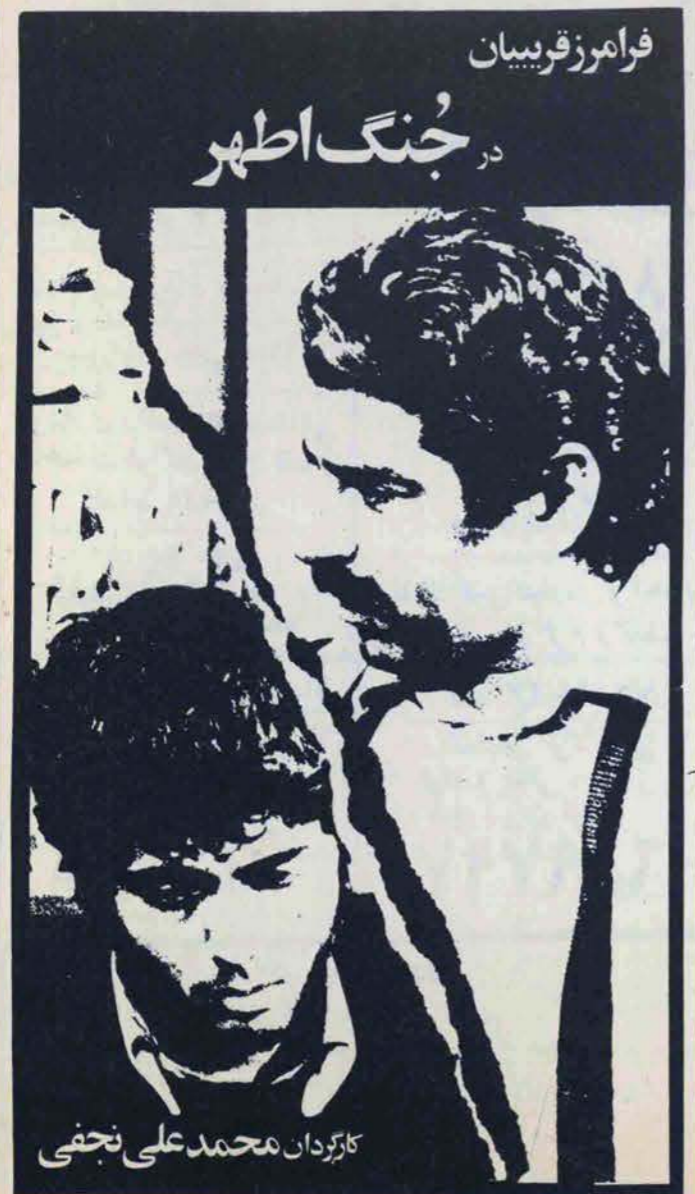
کازردان محمد علی نجفی

جنگ اطهر، حدیث معلم شهیدی که با مرگش راه مبارزه و پیروزی را به شاگردانش آموخت