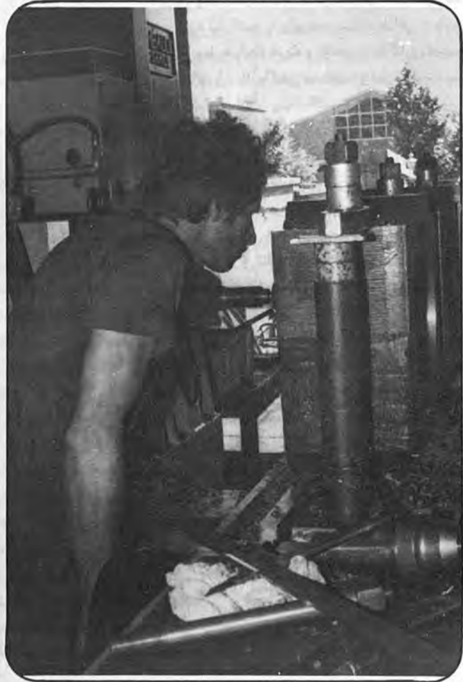
چگونگی ساخت قطعه اصلی یک ماشین کشاورزی

همچنین، بدولت ضمانت میدهم که کارها را با فقط ۰.۵٪ تا ۱.۰٪ سود انجام دهم نه مانند شرکتهای خارجی که گاهی اوقات بیش از ۳۰۰ درصد سود روی اجناس خود میکشند.