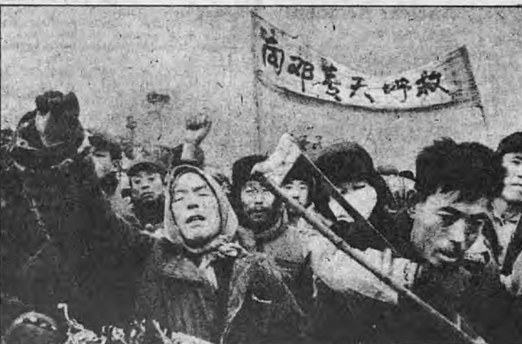
در میدان تینانمن پکن، گروهی از چینی‌ها از معاون نخست وزیر، دنگ سباپینگ خواستار دموکراسی و برسمیت شناختن حقوق بشر هستند.

سلطه سیاسی این حزب نمودند. ممکن است از افراد ارشدی که از زندان "کن جنگ" بیرون آمده‌اند سؤال شود: "هنگامیکه شما، زندانیان را بدلیل اظهار آزادانه عقاید سیاسی خود سرکوب میکردید آیا حقوق خود را تأمین و بدست می‌آوردید؟ پرداخت پول غذا: زندانیان در زندانهای انفرادی بعرض ۳ پهاو طول ۹ یا نگاهداری میشوند. اگرچه چین یک اجتماع بی طبقاتی آشکار است معذالک زندانیان در ۴ گروه طبق مبلغی که باید برای وعده غذای خود بپردازند (۵/۱۶/۲۶ دلار در ماه) تقسیم میشوند. این رقم بر مبنای حقوق مقرر آنها در مدت اقامت خود در زندان می‌باشد. ولی زندانیان بنسبت سهمیه کامل غذای خود را دریافت میدارند. این موضوع بدلیل فساد و ستگرگی محافظان است که همه زیر ۲۰ سال دارند و سگرات تعویض میشوند. مقداری