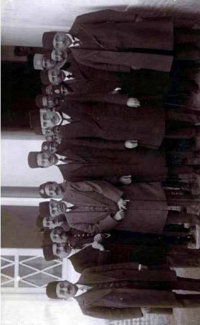
حسن وثوق الدوله رئیس الوزرا ، نصرت الدوله وزیر خراج و صارم الدوله وزیر داخله به همراه دیگر اعضای کابینه خود