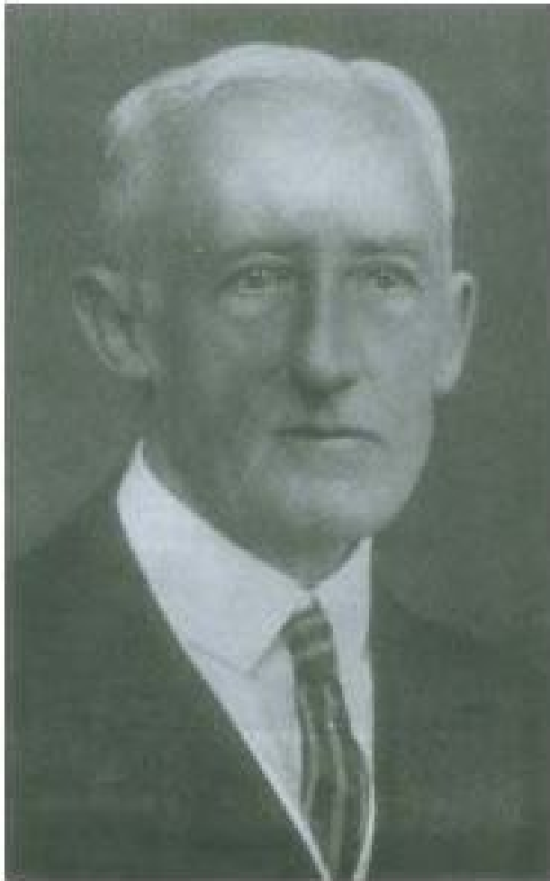
سر پرسی کانس