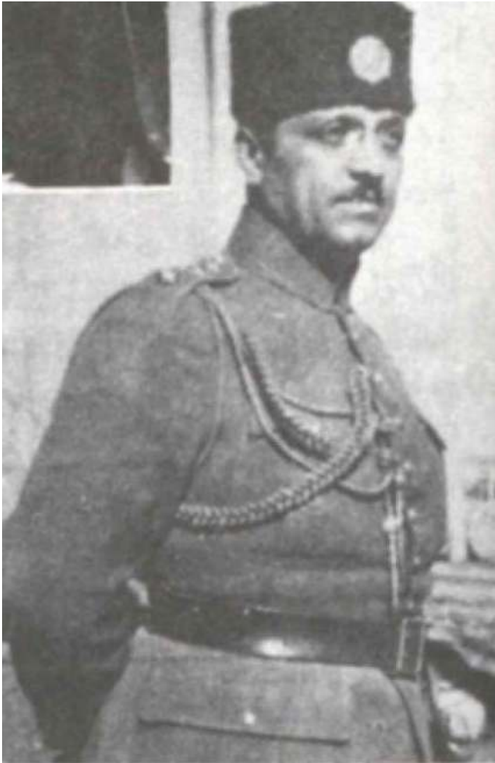
کلنل فضل‌الله خان آق‌اولی