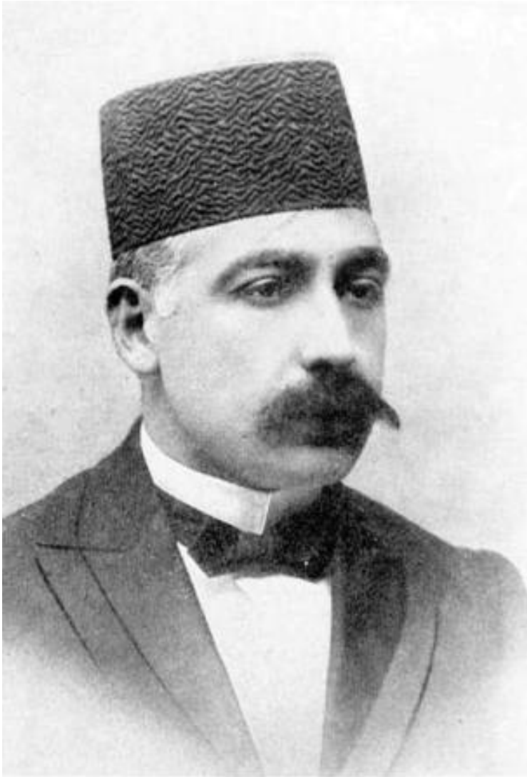
میرزا حسن وثوق الدوله