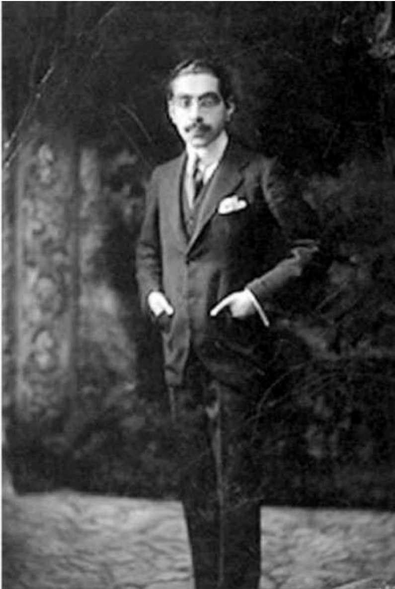
نصرت الدوله فیروز