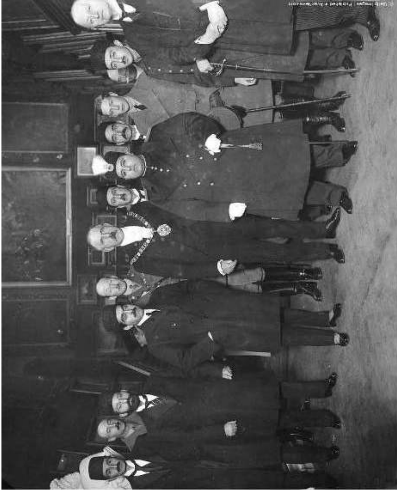
در عکس از راست بچپ نصرت الدوله، لرد مایور شهردار لندن، احمد شاه قاجار، پرنس آلبرت (بعلاً جرج ششم)، لرد کرزن در ضیافت نهار (نوامبر ۱۹۱۹)