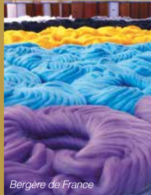
Bergère de France

Renseignements à l'Office de Tourisme Meuse Grand Sud.