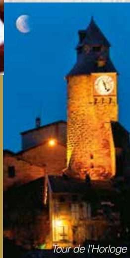
Tour de l'Horloge

© CDT de la Meuse - M. PETIT - G. RAMON Département de la Meuse - Bergère de France