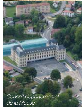
Conseil départemental de la Meuse