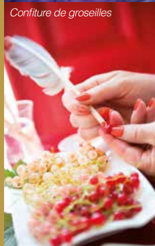
Confiture de groseilles

De couleur ambre ou rubis, ce caviar sucré est le résultat de l'habileté et de la patience des épépineuses. A l'aide d'une plume d'oie taillée en biseau, les pépins sont extraits un à un en les faisant glisser dans la hampe creuse de la plume d'oie. L'entaille est ensuite recouverte avec le lambeau de peau, afin de préserver au fruit son croquant et sa saveur.