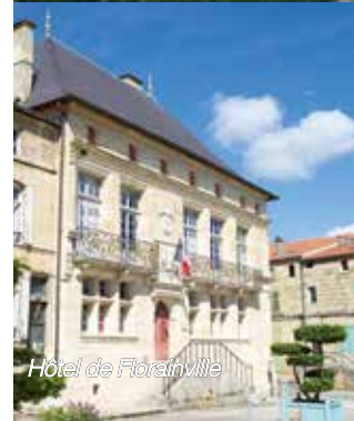
Hôtel de Florainville