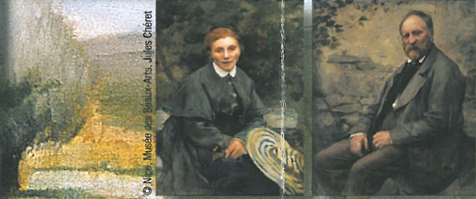
© Nice, Musée des Beaux-Arts, Jules Chéret

9 Square Jules Bastien-Lepage « La famille de l'artiste »