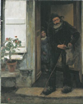
© Dordrecht, Musée In Carlsberg Synprotek