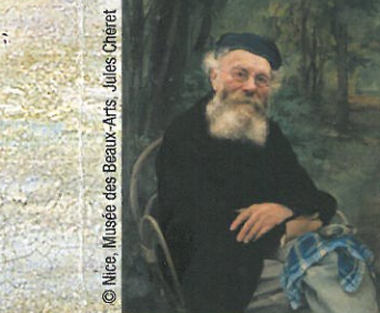
© Nice, Musée des Beaux-Arts, Jules Chéret

11 Rue du bastion Sainte-Barbe « Le grand-père »