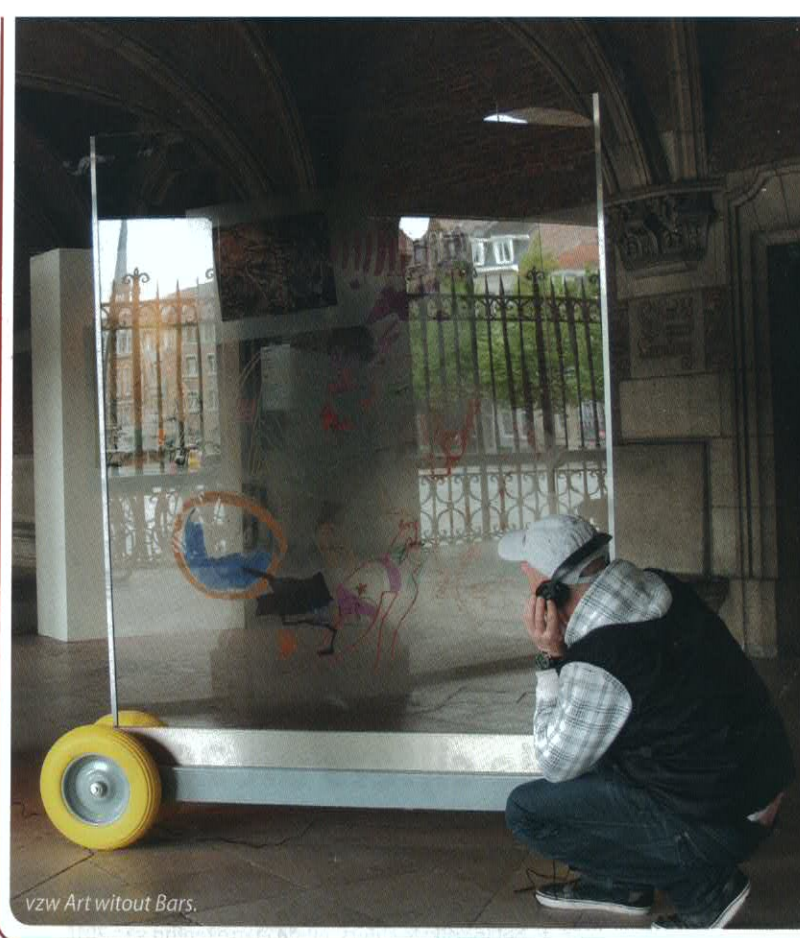
vzw Art without Bars.

Nu Art Without Bars buiten de muren van de gevangenis werkt, kan zij ook halfjaarlijks toonmomenten organiseren voor het publiek. Vermits de basiswet voorziet in het recht tot ontplooiing van alle burgers - met of zonder juridisch verleden- pleit onze organisatie aldus voor aandacht en herstel voor mensen die gefaald hebben. Art Without Bars helpt hen aan hun zelfvertrouwen te werken en hun zwakke en sterke punten te ontdekken. Top Hats is er voor éénieder die aan herstel toe is, ongeacht zijn of haar levensbeschouwelijke achtergrond. Wat de deelnemers beweegt om wekelijks naar het Poorthuis te komen, is hun ervaring, namelijk dat 'kunst zonder tralies' bevrijdend werkt.