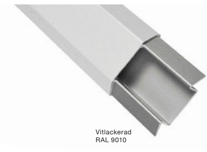
Vitlackerad RAL 9010