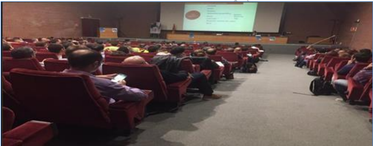
Jornadas Análisis de perfiles criminales de la EEC en el Instituto de Seguridad de Cataluña.

Este término que nos define, del latín “securitas”, implica ausencia o minimización de riesgos, en los avatares de la vida, (incluida la profesional), lo que también supone, a contrario sensu de la llegada a una situación de cero riesgos, que a pesar de que de manera insospechada y, paradójicamente, muchas son las personas y profesionales del sector, en realidad, pocos, los que en espíritu y afán de ser los mejores en su faceta formativa, la vivimos con vocación, haciendo de ella la prestación de un SERVICIO SEGURO de calidad y satisfacción.