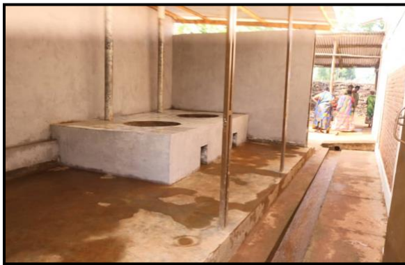
Ruimte met de stookinrichting voor de pasteurisatie van het sap