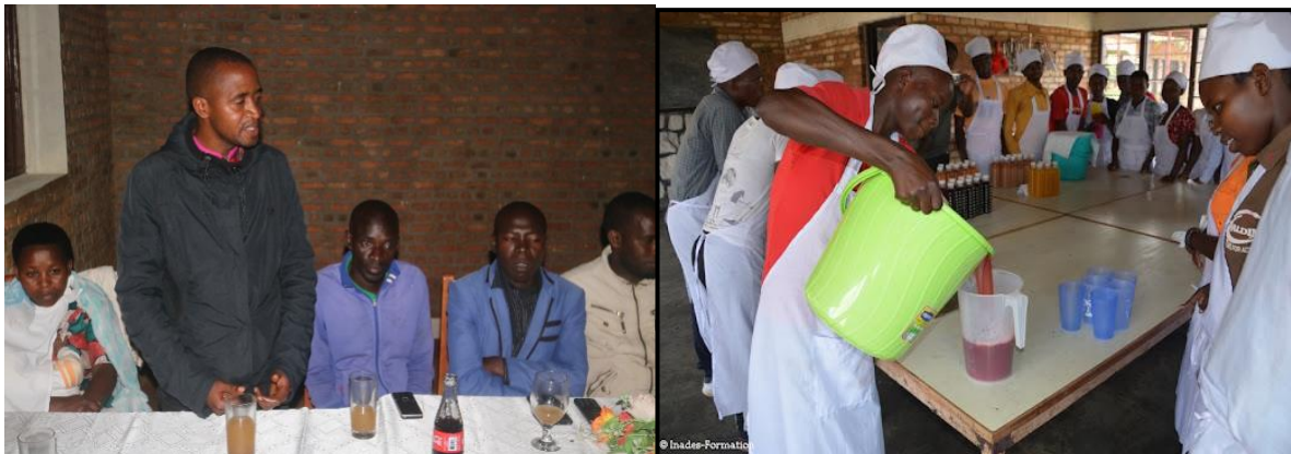
De adviseur van het gemeentebestuur van Mbuye houdt een toespraak bij de lancering van het bananenbier « Agateka Wine ».