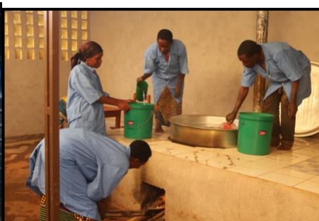
(4) Sap pasteurisatie