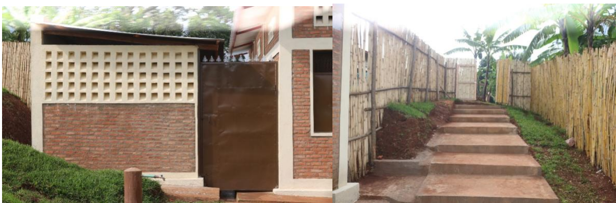
Ruimtes waar het bananenbier wordt gemaakt (gebouwd met hulp van extra fondsen)