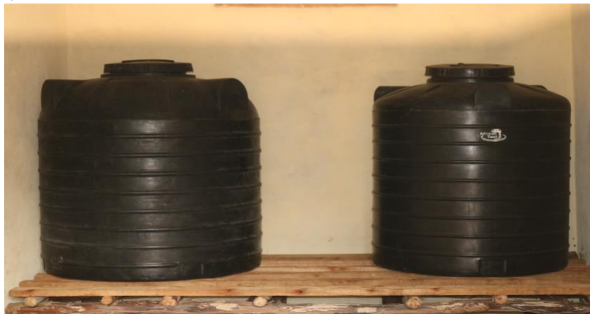
De vaten waarin het bananenbier rijpt.