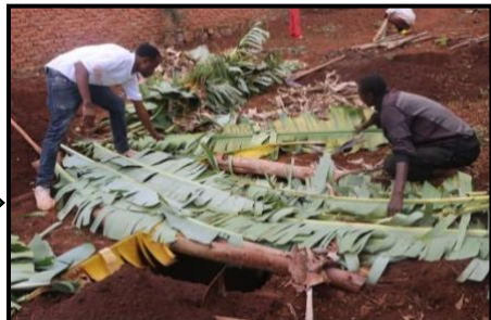
(2) Rijping van de bananennit