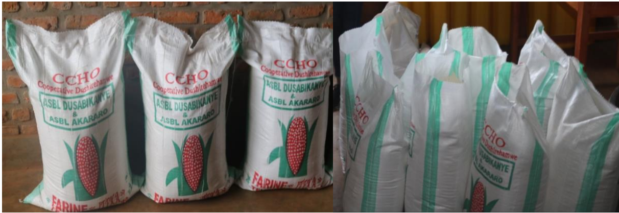
De maismeelzakken van de coöperatie Dushirehamwe zijn voorzien van het Iteka-logo.