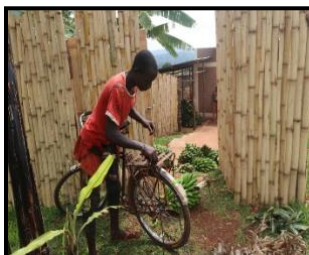
(1) Aanvoer van bananentrossen