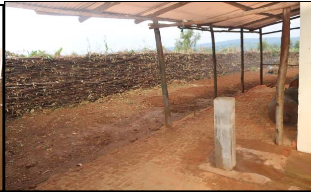
Plek waar de bananentrossen kunnen rijpen