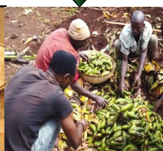
(3) Rijpe bananen klaar om geperst te