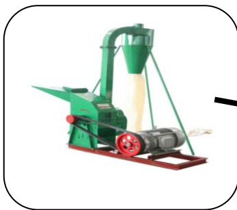
Van de molen naar de winkel van de coöperatie.

Dankzij dit project kon met het door de coöperatie verdiende geld een winkel worden geopend, waar het door de coöperatie geproduceerde maismeel kan worden verkocht. De klanten zijn zeer te spreken over de kwaliteit van het maismeel en het is dan ook het meest verkochte product.