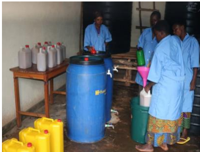
(1) Wijrijping en afvullen van blikken worden