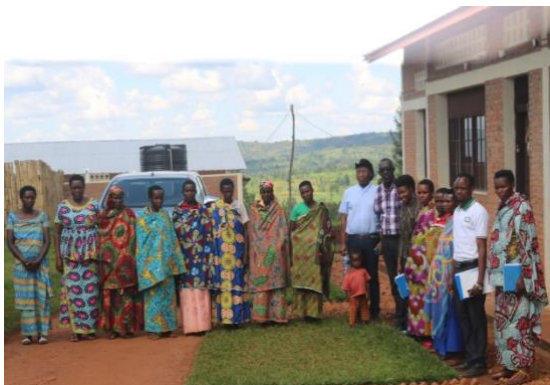
De leden van het Dagelijks bestuur na afloop van de evaluatie.

In mei 2022 ging het project van start en in april 2023 is het project ten einde gekomen. Uit de 187 beoogde gezinnen hebben zich uiteindelijk 142 vrouwen verbonden aan het project, door lid te worden van de officieel in het leven geroepen coöperatie. Als we de behaalde resultaten afzetten tegen de beoogde doelen, dan is dit project vrijwel 100% succesvol geweest. In deze eindrapportage zullen de onderdelen van het project afzonderlijk worden geëvalueerd.