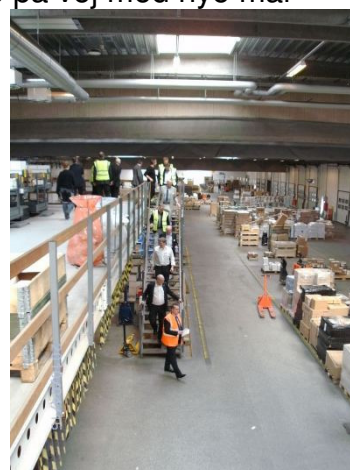
Lidt motion blev det også til

Dette var lidt stemningsbilleder fra den interessante rundvisning hos LM i Kolding