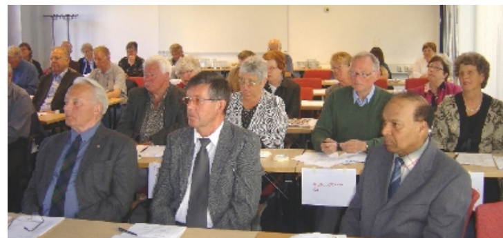
Pek på foto for mer informasjon