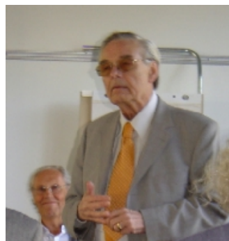
Odd Reinsfelt ordfører i Bærum