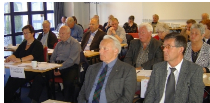
Pek på foto for mer informasjon