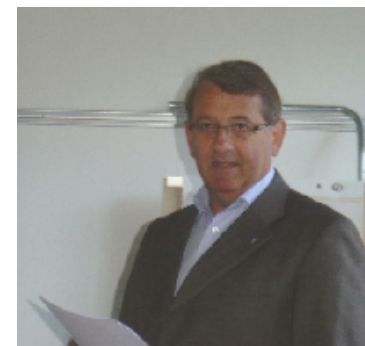
stortingsrepresentant for Høyre Per-Kristian Foss