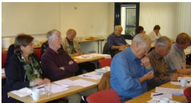
Pek på foto for mer informasjon