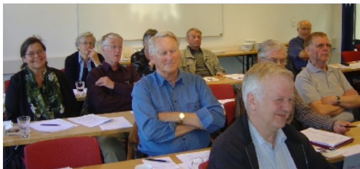
Pek på foto for mer informasjon