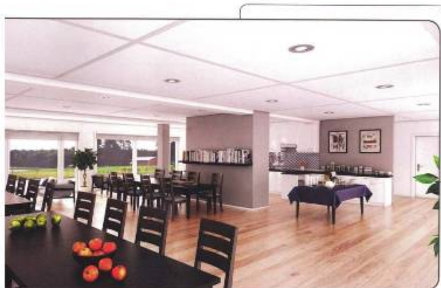
Møteplasser og fellesrom er oppkølet til dette