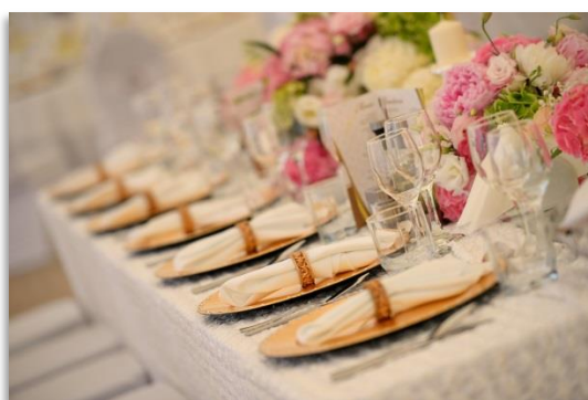
4-Gang-Menü ab ca. € 115,- bis € 125,- (zzgl. MwSt. 19%)