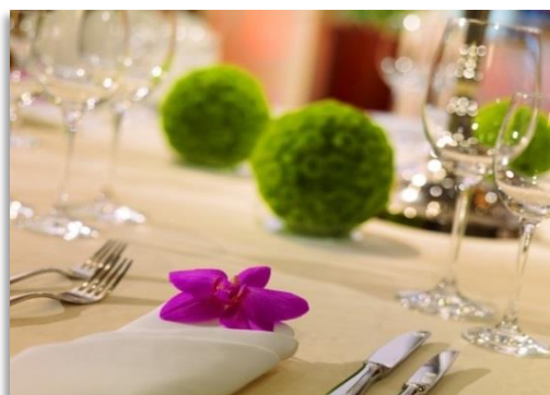
3-Gang-Menü ab ca. € 86,- bis € 107,- (zzgl. MwSt. 19%)

Frei nach Ihren eigenen Wünschen gestalten wir Ihnen gern Ihr individuelles Hochzeitsmenü in Kooperation mit unseren erstklassigen Cateringpartnern. Oder Sie organisieren Ihr eigenes Catering frei nach Ihren Präferenzen – wir versuchen, jeden Ihrer Wünsche zu erfüllen.