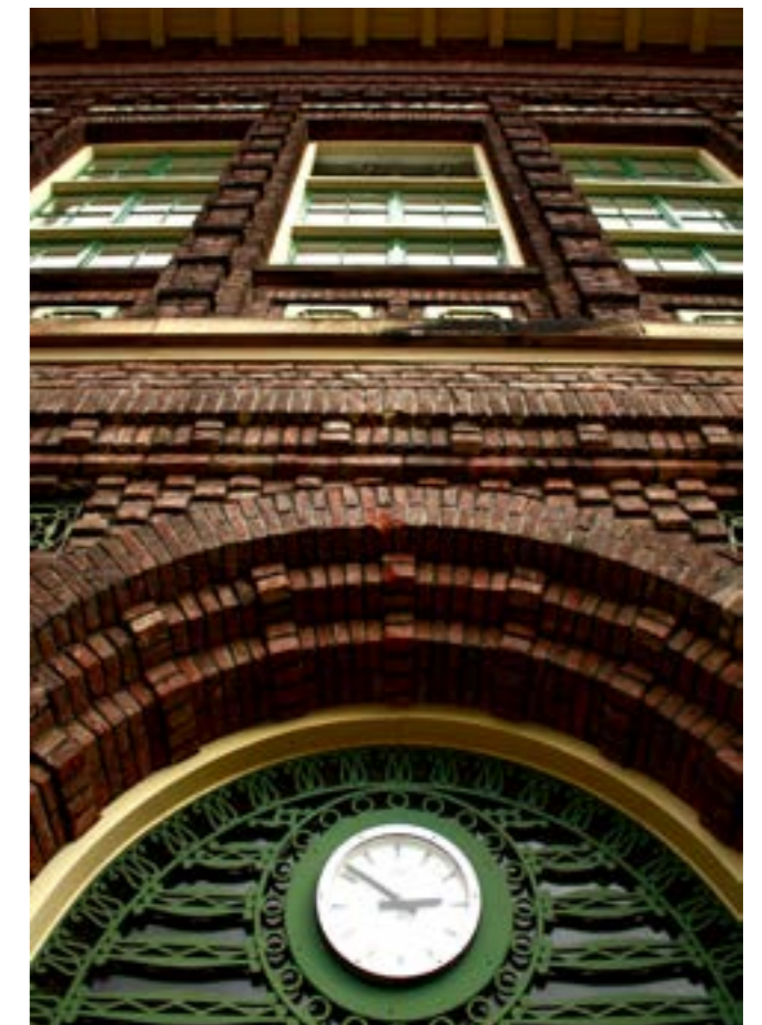
De Maere zit vol met historische elementen en details