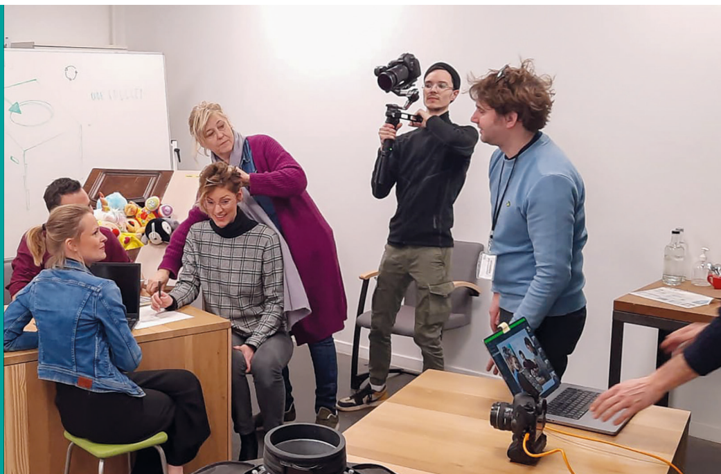
Op de campagnebeelden staan eigen medewerkers, authenticiteit en geloofwaardigheid zijn essentieel!

Ook Deltagroep voelt de krapte op de arbeidsmarkt. Een breed gedragen campagne in de regio moet het werkgevers- imago van Deltagroep, De Kringloopwinkel, Constructief en Mobiel een 'smoel' geven. Zo willen we mensen overtuigen om samen met ons het verschil te maken.