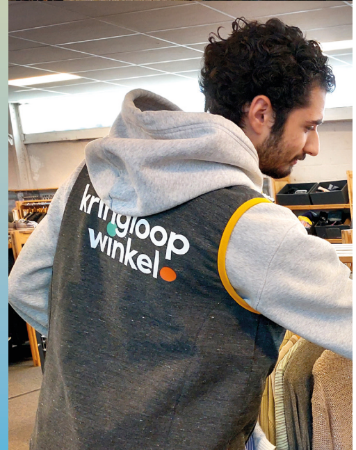
De nieuwe hesjes passen perfect boven de eigen kledij.

"De keuze voor milieuvriendelijke hesjes hoort bij het DNA van De Kringloopwinkel. Eerder vervingen we ook al vervuilende fleecetruien door milieuvriendelijk geproduceerde kledij."