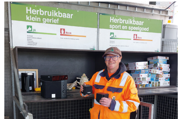
Parkwachters van IMOG zullen een opleiding krijgen om elektro beter te sorteren.