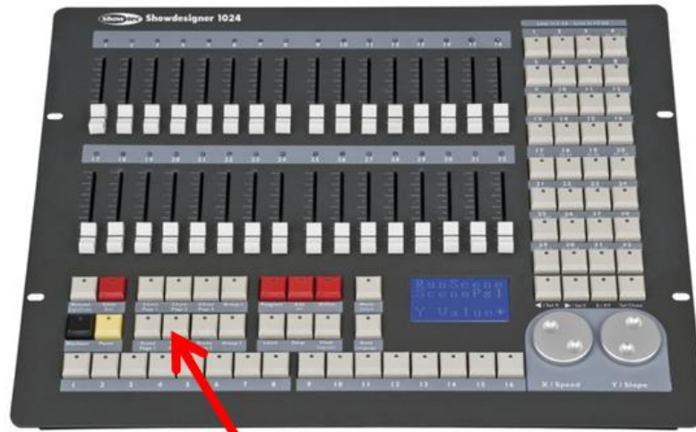
Scene Page 2