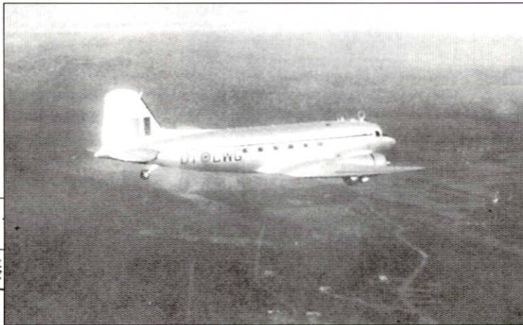
22 jul 1950 DC3 OT-CWG K16 in vlucht van Genève naar Evere DC3 OT-CWG K16 en vol de Genève à Evere

Ter vervollediging van het artikel dat verscheen in het vorige nummer vindt U hieronder twee documenten die ons zeer interessant lijken om de vertelde gebeurtenis te illustreren.