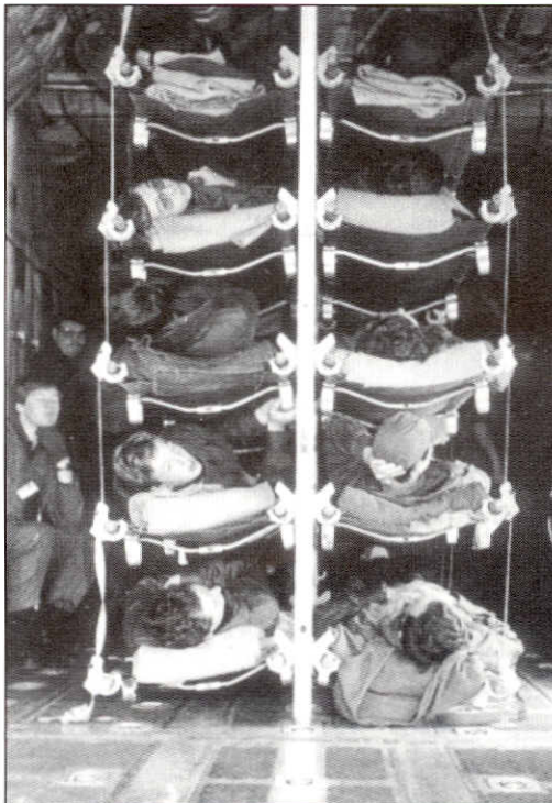
Dans la version SANEVAC le C130 peut transporter 74 brancards - In de SANEVAC versie kan de C130 74 liggende gewonden vervoeren

De vliegtuigen moesten in het wit geschilderd zijn en duidelijk het kenmerk van het Rode Kruis dragen naast de nationale kleuren, aan boven- en onderzijde. België heeft gedurende het Interbellum nooit sanitaire vliegtuigen van