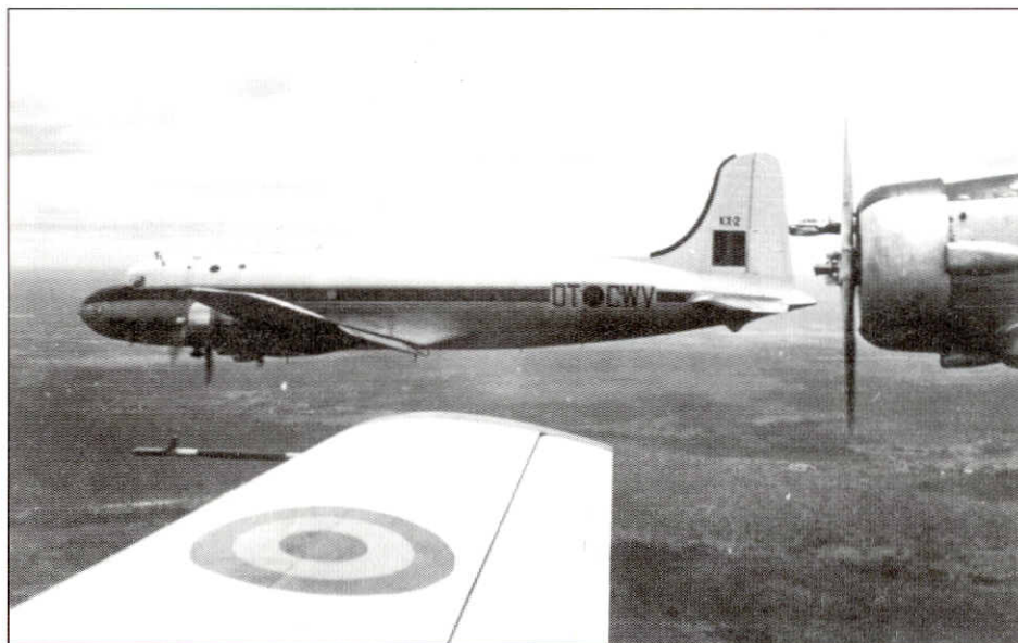
DC4 escorté par des Harvards

's Anderendaags verlieten de Belgische strijdkrachten Kindu. Zes C-119 waren nodig voor deze opdracht, maar vermits er, op de kleine dispersal, slechts plaats was voor drie toestellen, moest deze terugtocht in twee