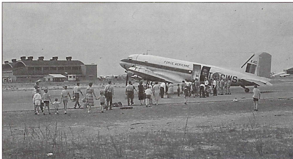
Kamina, évacuation de familles vers Kolwezi evacuatie van families naar Kolwezi

De Fouga Magisters werden terug gevlogen naar België, om er bij die van de Trainings Wing in Brustem gevoegd