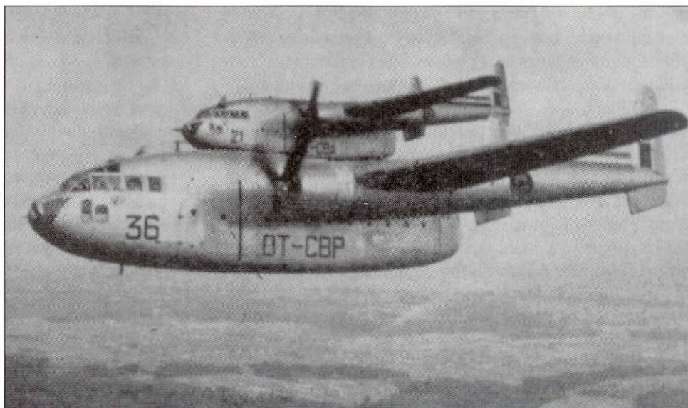
Le C-119 CP 36 s'écrasa à Saké-Masisi le 19 juillet 1960

De Flying Boxcars vlogen in "line astern" of "trail" for-