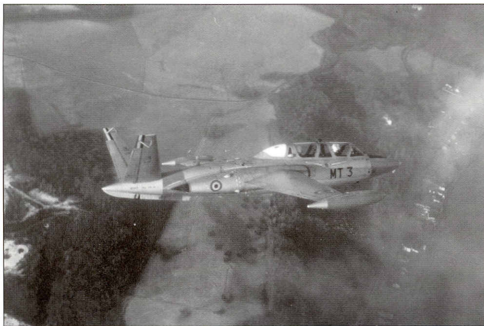
Des Fouga Magister renforceront également le Flight "Appui Feu" à Kamina

(Toch was het een goede zaak voor de Belgische Luchtmacht dat de Para's de zaak in handen hielden, vermits zij, toen zij enkele dagen later ternauwernood ontsnapten aan een hinderlaag, Kikwit -zonder hun aanwezigheid- niet hadden kunnen gebruiken als tussen-