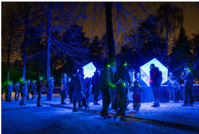
Guidade turer hålls på olika platser i staden och berättar om bakgrunden till varje verk. (Copenhagen Light Festival, Foto av Christoffer Askman, vnr.TV)

De guidade turerna har varit mycket populära och kan nu bokas på hemsidan. Ljusverken, skapade av skickliga konstnärer, är gratis att beskåda och visas vackert utomhus. Guiderna ger bakgrundshistorier och insikter om konstverken under turer som varar drygt en timme, antingen till fots eller med kanalfärjan Strömman.