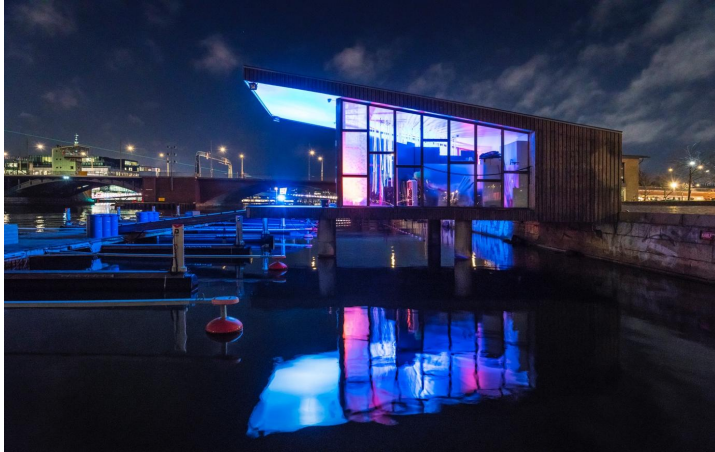
Flera ljusverk kommer att placeras längs vattnet vid nästa Copenhagen Light Festival (Copenhagen Light Festival, Foto av Christoffer Askman, vnr.TV)