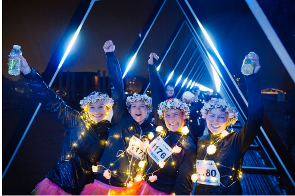
Ljusloppet hålls söndagen den 9 februari i Innerstaden. (Copenhagen Light Festival, Foto av Christoffer Askman, vnr.TV)