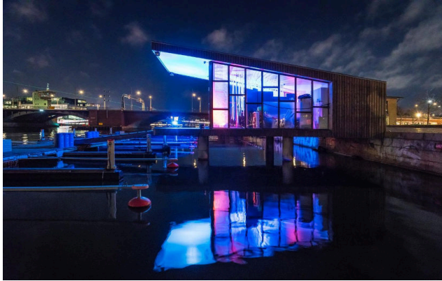
Mehrere Lichtinstallationen werden am Ufer des nächsten Copenhagen Light Festival aufgestellt. (Foto: Copenhagen Light Festival, vnr.TV).