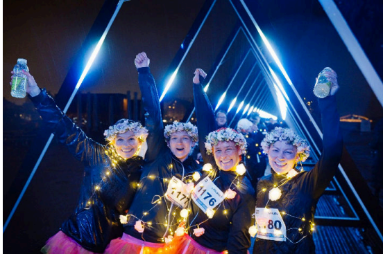
Der Lichterlauf findet am Sonntag, den 9. Februar in der Innenstadt statt.