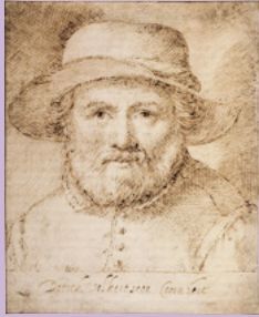
Portret van Coornhart (zelfportret?) Tekening in een exemplaar van een van Coornherts boeken

Van de vrijdenkers Erasmus, Coornhart, Descartes en Spinoza is Coornhart ongetwijfeld de minst bekende. Omdat hij uitsluitend in het Nederlands schreef – want hij wilde de gewone mens bereiken – en niet in de taal voor geleerden, het Latijn, werd hij geen onderdeel van bredere debatten in Europa. Hij was erg kritisch zowel over de katholieke kerk als over de gereformeerden. Zo werd hij de held