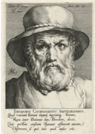
Jan Harmensz. Muller (naar Cornelis Cornelisz. van Haarlem) Portret van Dirck Volckertsz. Coornbert, 1613–36

Dirck Volckertszoon Coornhert werd in 1522 in Amsterdam geboren. Zijn ouders kwamen uit welvarende families. Na een opleiding als prentmaker en een verblijf van een jaar in Spanje en Portugal, keerde hij in 1539 in Amsterdam terug. Hij trouwde, pas zeventien jaar oud, met een uit Haarlem afkomstige twaalf jaar oudere vrouw van eenvoudige komaf. Zijn ouders waren daar zo op tegen dat hij werd ontferd. Om de kost te verdienen werd hij hofmeester op kasteel Batestein in Vianen, bij Reinout van Brederode.