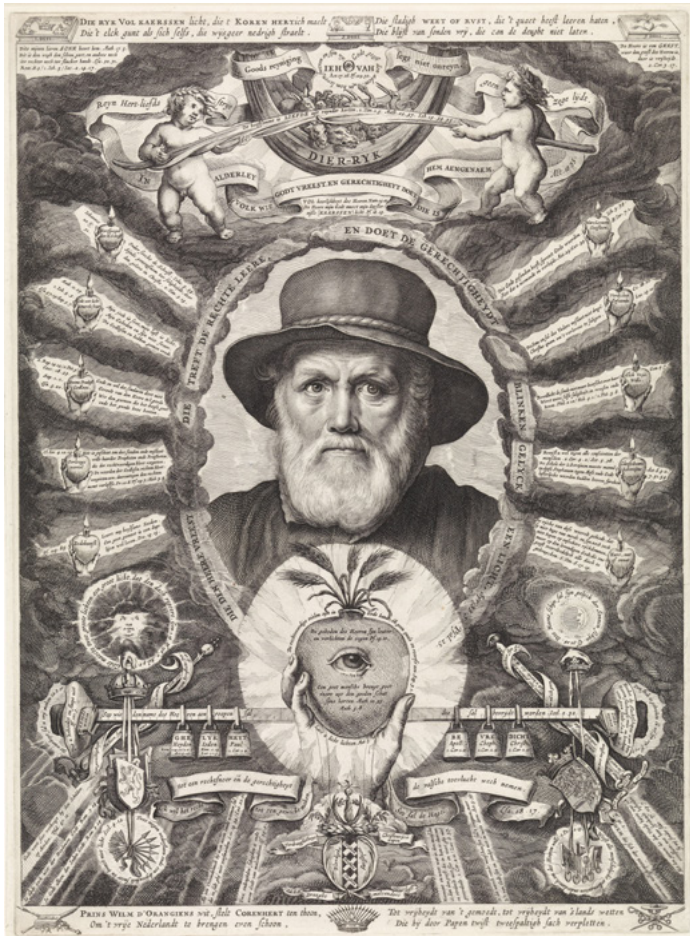
Theodor Matham Portret van Dirck Volckertsz. Coornbert in allegorische omlijsting, 1647-50

Coornhert en Willem van Oranje ontmoeten elkaar voor het eerst in Haarlem in september 1565. De maanden daarna wordt Coornhert steeds nauwer betrokken bij stedelijke activiteiten tegen het Spaanse bewind en bij landelijke (politieke) kwesties. Hij krijgt intensief contact met de prins en fungeert in de praktijk als liaison met de eigenzinnige Hendrik van Brederode, een van de leiders van de Opstand. Deze zetelt op het iets buiten Haarlem gelegen Huis ter Kleef. Hendrik is trouwens de stiefzoon van Coornherts schoonzus. In 1566 stelt de prins aan Coornhert voor bij hem als adviseur in dienst te treden, maar dat wijst deze af, vermoedelijk omdat Coornhert wel wist dat hij slecht lag bij de gereformeerden en dat dit hem in zijn functioneren zou belemmeren. Willem van Oranje is ongetwijfeld in zijn denken en beleid beïnvloed door Coornherts opvattingen op het gebied van tolerantie en godsdienstvrijheid. De politieke hoogtijdagen van Coornhert zouden echter van korte duur blijken. In 1567 wordt de situatie voor de opstandelingen zo benard dat Oranje, Brederode en Coornhert naar Duitsland uitwijken. Bij zijn terugkeer in 1572 wordt Coornhert op voorspraak van de prins secretaris van de Vrije Staten van Holland, maar om aan een moordaanslag te ontkomen verlaat hij na enkele maanden de Nederlanden en keert pas eind 1576 terug. Met Oranje heeft hij dan vrijwel geen contact meer.