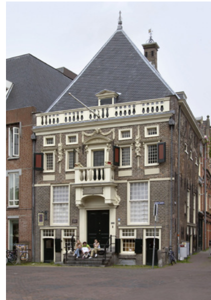
Hoofdwacht, Grote Markt, Haarlem In het onderhuis had Coornhert van 1561–1564 een drukkerij.

Na enkele jaren verhuisde hij naar Haarlem. Hier ging hij in zijn levensonderhoud voorzien als prentmaker, waarbij hij veel met Maarten van Heemskerck samenwerkte. In 1561 begon hij een drukkerij en uitgeverij. Daarnaast werd hij notaris. Begin 1562 trad Coornhert in dienst van de stad. Hij maakte snel carrière en werd in 1564 stadssecretaris. Na een korte periode als vooraanstaand adviseur en medestander van Willem van Oranje, volgen met enkele onderbrekingen jaren