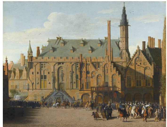
P. Saenredam Stadhuis van Haarlem, ca. 1628 Op de benedenverdieping van de aanbouw rechts had Coornhert van 1564–1567 zijn werkvertrek.