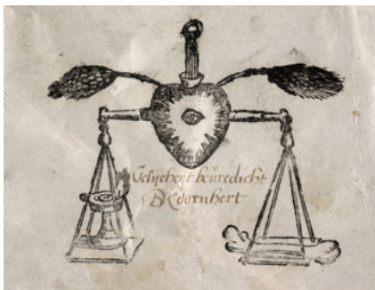
Ghelycheijt bevedicht Notarismerk van Coornhert, onder een testament uit 1567