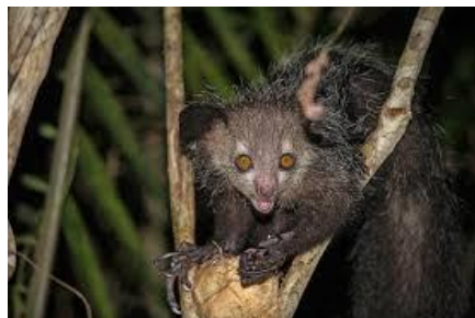
Lemur Aye aye.

Actualmente, todos los lémures están en peligro de extinción, principalmente por la pérdida de su hábitat. Esto se produce porque mucha gente se está mudando a las selvas donde viven estos animales y tala los árboles para construir granjas o casas. Sin árboles, los lémures tienen problemas para encontrar un lugar donde vivir y comida para alimentarse. Como resultado, varias poblaciones de lémures están reduciéndose.