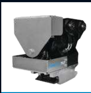
CTR3 Max 3T