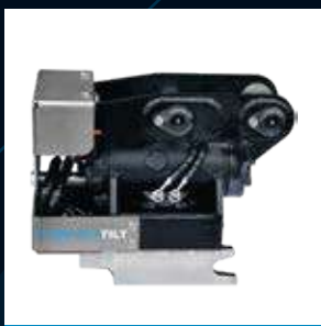
CTR2 Max 2T