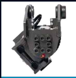
CT2 Max 2T