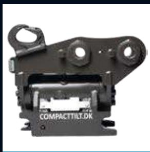
CT6 Max 6T