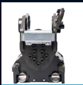
CT10 Max 10T