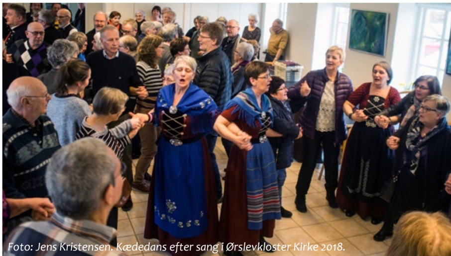
Kædedans efter sang i Ørslevkloster Kirke 2018.