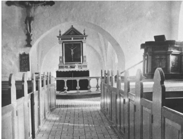
Sådan så Borris kirke ud indvendig. Krucifikset fra 1400-tallet, som ses på korvæggen, havnede på Nationalmuseet, idet man ikke mente, det ville passe i den nye Sparkær kirke. Derimod blev døbefont, kirkeklokke, alter, alterskranke og prædikestol overført.

Borris kirke var viet til Sct. Nicolaus. Det var en enkel middelalderbygning af kampesten, enkelte granitkvadre, samt munkesten. Døre og vinduer var fladbuede (norddøren tilmuret). I koret var der et ottedelt sengotisk hvælv, mens skibet havde bjælkeloft. Et våbenhus mod syd kom til i 1700 tallet. I kirken var ophængt et sengotisk krucifiks, som nu befinder sig på Nationalmuseet.