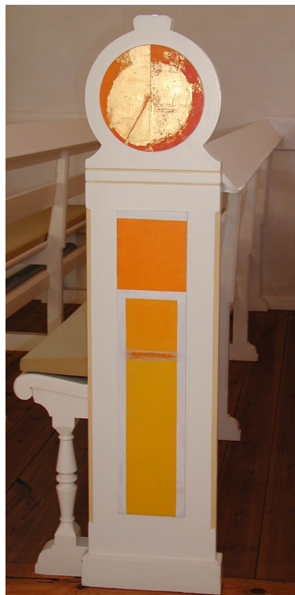
Klokken 7 - dagen er begyndt

”Som forårssolen morgenrød stod Jesus op af gravens skød...”