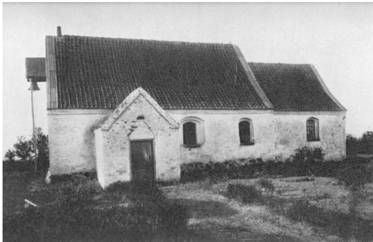
Borris kirke som den så ud kort før nedrivningen.