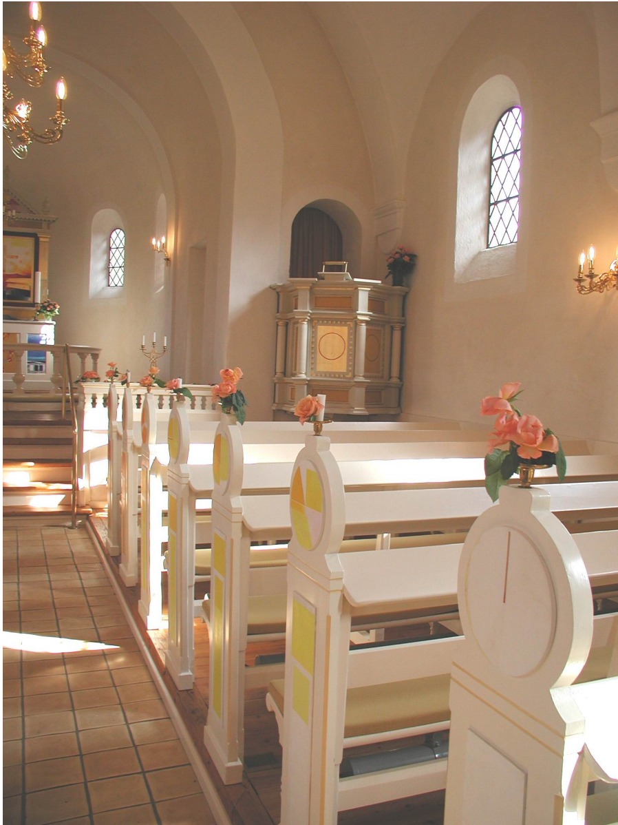
Sydsiden i sol

Tekst og fotos, hvor intet andet er angivet: Karen Greve