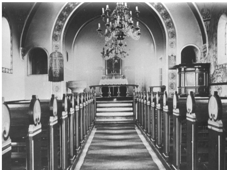
Sparkær kirke som den så ud fra begyndelsen. Der var udsmykning i koret, på hvælv, vægge og træværk - i mange farver!

Fra Borrís kirke overførtes en del inventar til den nye Sparkær kirke. Først og fremmest døbefont, prædikestol, alter, alterskranke og kirkeklokke.