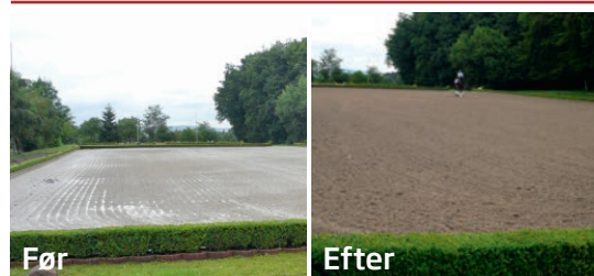
Arpolith - støv- og vandkontrol