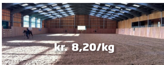
"Grey fibre" - fiberbane