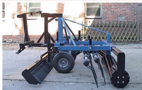
IAT - den ultimative baneplaner