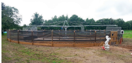
Skridtmaskiner - m/u tag