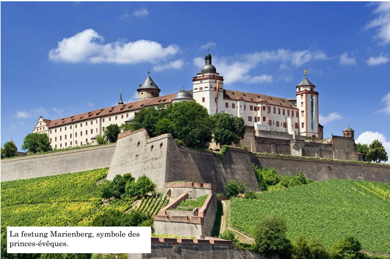
La festung Marienberg, symbole des princes-évêques.

Dans les années 1930, Wurtzbourg connaît le destin de n'importe quelle ville allemande. Les premières lois anti-juives sont prises et la population, ultra-catholique mais très réceptive aux discours du NSDAP, choisit comme Maire Theo Memmel qui prolongera, dans la plus grande inégalité, son mandat jusqu'en 1945. La résistance dans la région est plutôt faible et la collaboration avec le régime énorme. La population juive de Wurtzbourg, bien que faible, est déportée en 1942. La ville sera ensuite durement bombardée en 1945 où 90% de son centre historique est rasé. Aujourd'hui, malgré la reconstruction, les stigmates des bombardements restent visibles, surtout dans les églises où l'on est pris d'une drôle d'impression. En effet, j'ai eu l'impression, malgré le fait qu'elles aient été reconstruites à l'identiques, que quelque chose d'indescriptible et d'insondable manquait à ses églises, comme une présence. C'est hélas peu aisé à retranscrire avec des mots mais cette sensation vaut la peine et j'espère pouvoir l'expérimenter à nouveau.