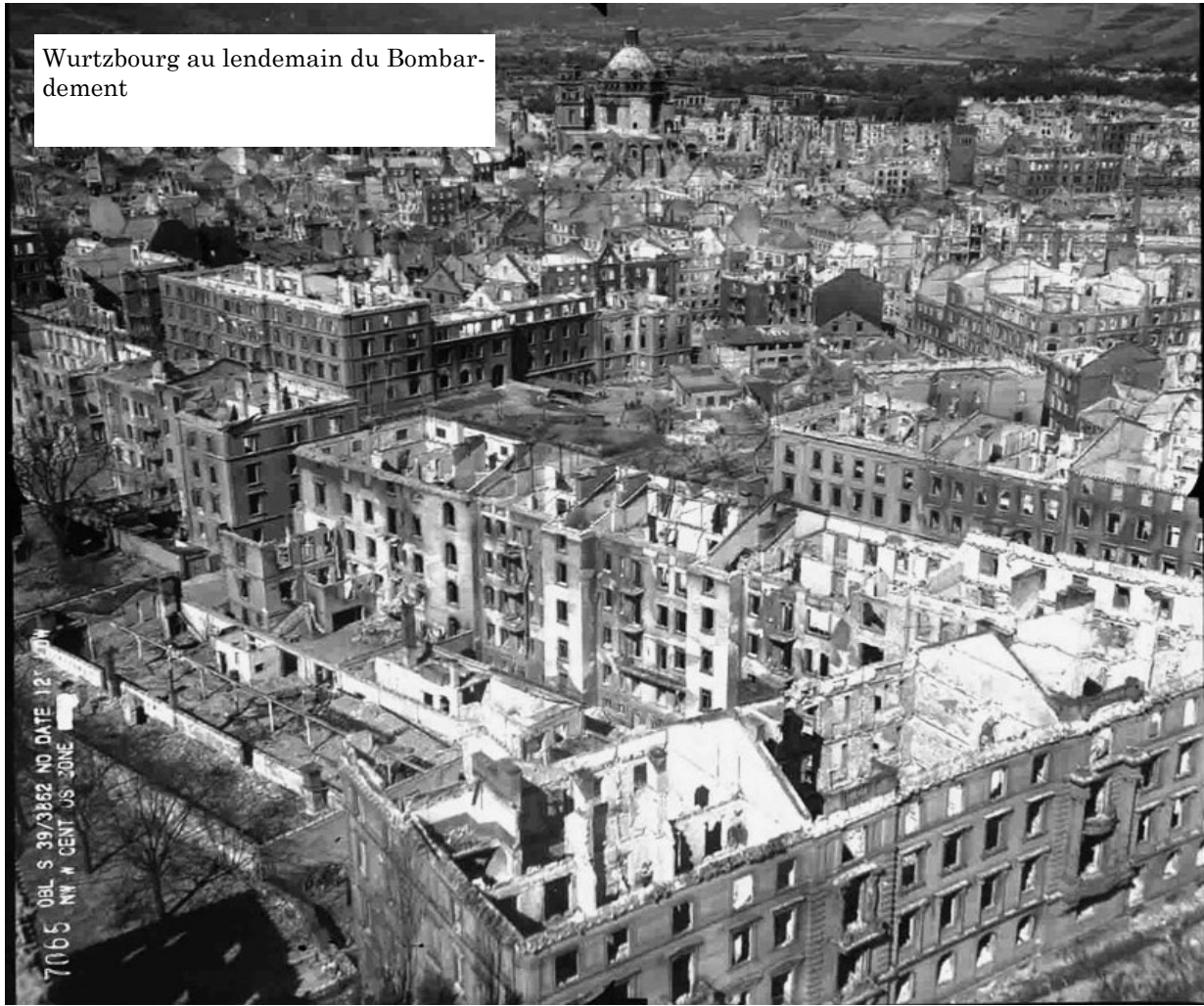
Wurtzbourg au lendemain du Bombar- dement