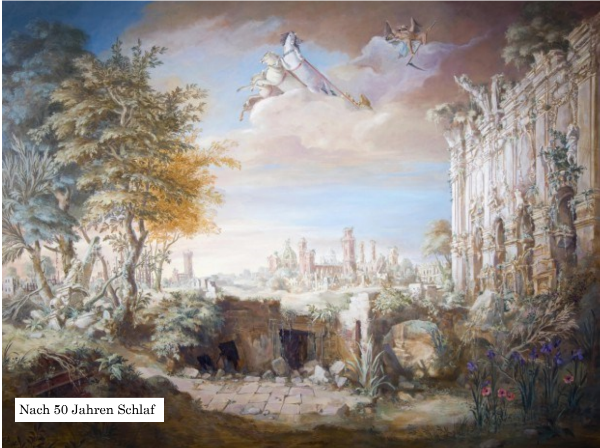
Nach 50 Jahren Schlaf