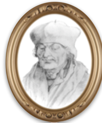
ERASMUS FRA ROTTERDAM: "MENNESKER FØDES IKKE, DE DANNES."