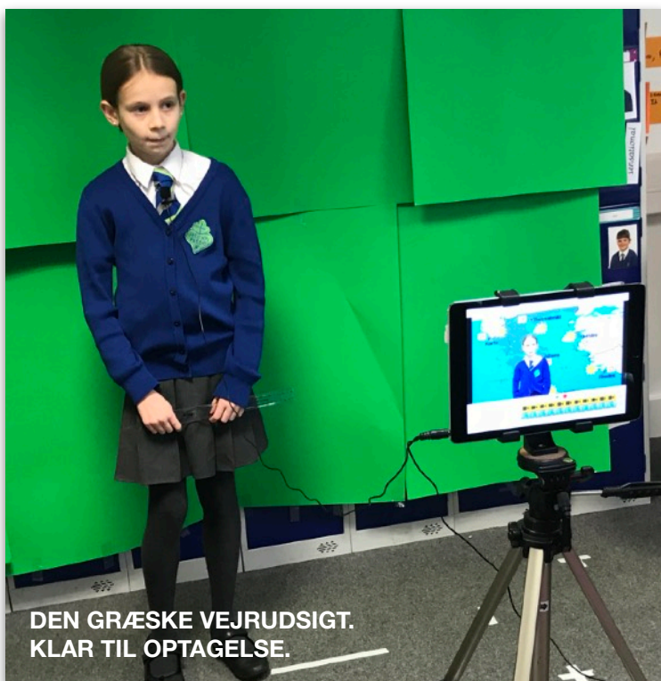
DEN GRÆSKE VEJRUDSIGT. KLAR TIL OPTAGELSE.

Jeg har lige haft et hold til at overtage al undervisning på Øster Åby Friskole,