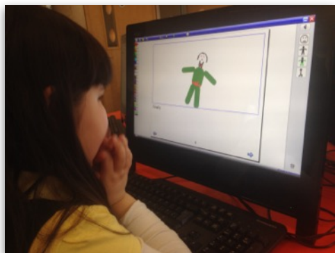
SE EN KORT FILM FRA FORLØBET

Derefter var vi i mindre grupper inde hos en 1. klasse, der var i fuld gang med at skrive (hertil havde de vist fået lidt hjælp) og animere en historie. Ud med børnene og så fortalte Gillian og vi spurgte. Learning Centers, ICT, Computer Science, Scratch, Logo, Python og andre spændende begreber røg gennem luften. Vi var godt trætte og dagen godt brugt, da vi kom hjem.