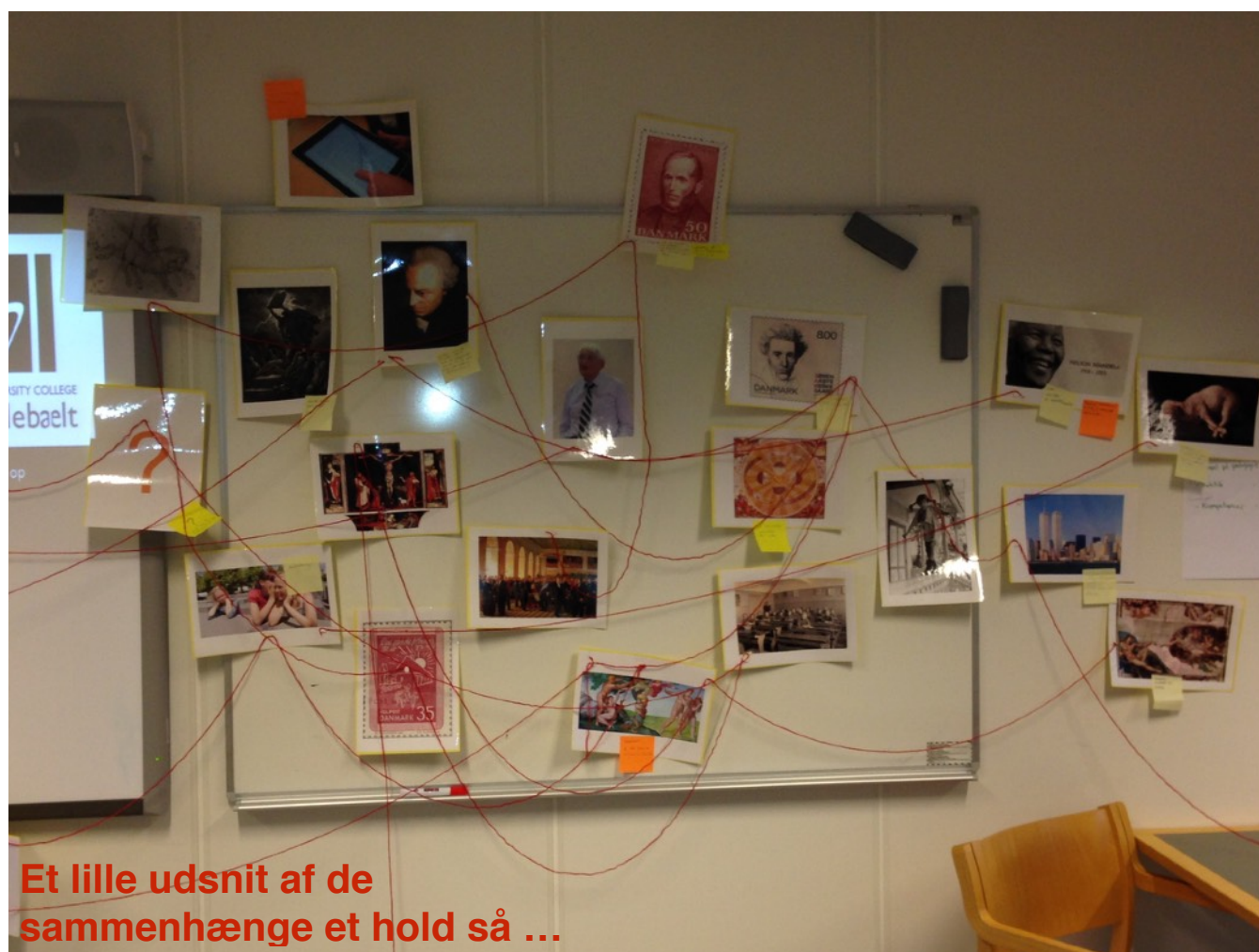
Et lille udsnit af de sammenhænge et hold så ...

Der kom faktisk en del guldkorn, der kunne ses som tegn på refleksion og forståelse. Dernæst prøvede vi at se på hvad der var forbundet – og jeg lavede mit sædvanlige nummer med at trække den røde tråd op fra tasken og forbinde billederne. Der skulle bruges flere røde tråde, men jeg tror at alle forstod at de lever i en verden, hvor der er sammenhænge, hvis man gider at lede efter dem. Jeg havde overvejet om jeg