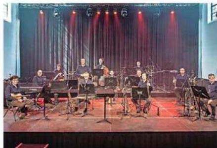
Het CineMusic Orkest stelde voor 4 mei een programma samen met muziek uit oorlogsfilms.

Ruud formeerde het elfkoppige CineMusic Orkest, dat onder leiding