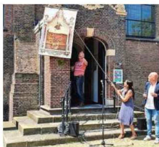
Opening vernieuwd plein.

Naast de naamsverandering zijn elf nieuwe bankjes geplaatst op het plein. Deze bankjes zijn aangeschaft met steun van onder anderen Vrien-