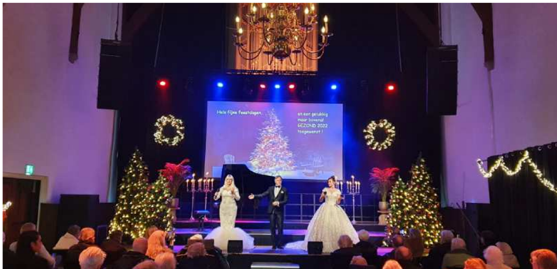
La Familia - Kerstconcert

Op zaterdagmiddag 18 december organiseerden we een Kerstconcert van 'La Familia'. Hiervoor nodigden we in totaal 62 bewoners van de nabijgelegen verzorgingshuizen Pennemes en Saenden uit. Zij mochten het concert tegen een sterk gereduceerd tarief bezoeken en beleefden een prachtige middag, nog nét voordat we weer moesten sluiten ivm Corona.