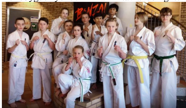
Bollebygd kyokushin fighters på Oki Kodomo 2019.

På Oki Kodomo Open 2019 26/5 hade Bollebygds kyokushin Kai 12 tävlande fighters.