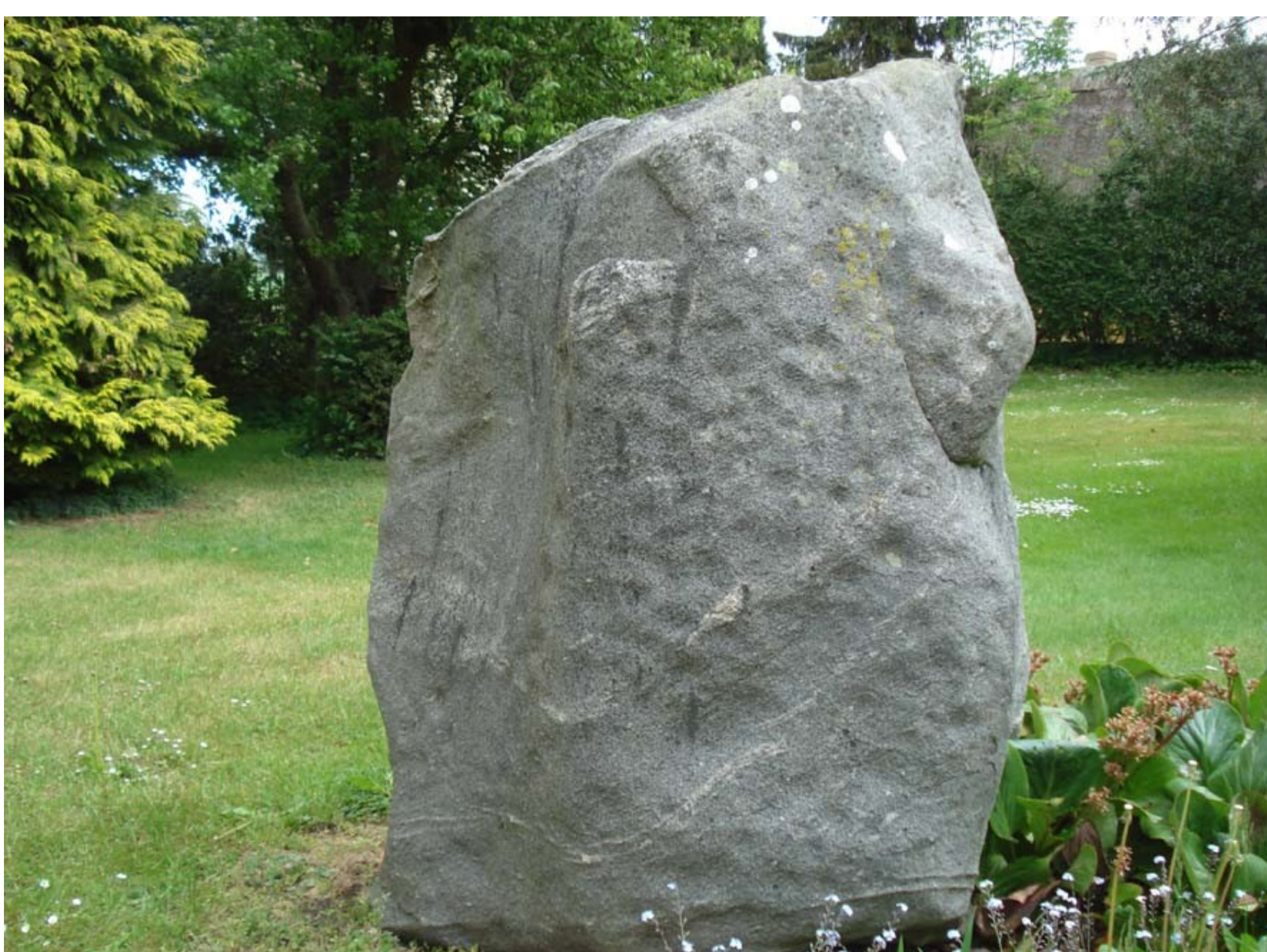
Bronzealder skålsten, Dreslette.

Den moderne skulptur "SUN", opstillet i Brydegård 2016 ved krydset Helnæsvej /Brydegardsvej, refererer til bronzealderens symbolsprog.