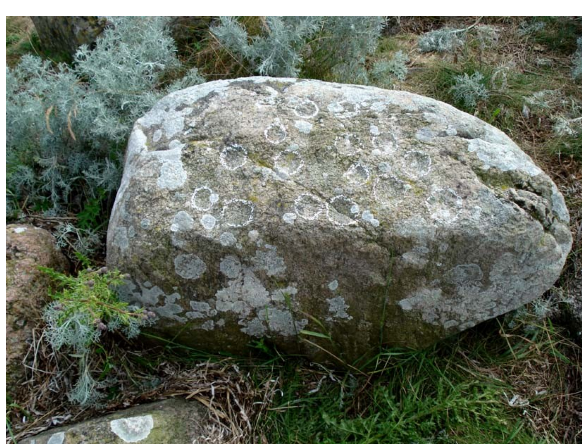
Bronzealder skålsten, Tjørnehoved.