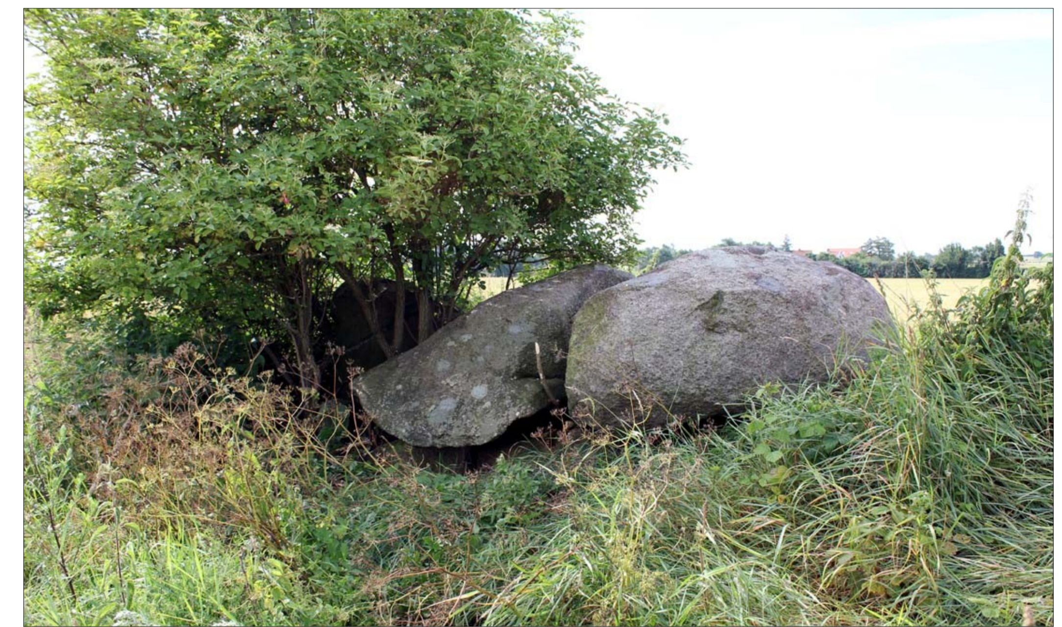
Højbo dysse.

Omkring 4000 f.kr. sker der et skift fra jægerkultur til bondekultur med agerbrug og husdyrhold. Derfor kaldes denne periode ofte bondestenalder. Det er her man begynder at fremstille de store slebne flinteøkser og oldtidens flot dekorerede lerkar. Bopladserne lå langs kysten og ved søer og vandløb, medens stendysser har ligget lidt højere i det dyrkede agerland. Langt de fleste stendysser er i dag forsvundet. Dyssen "Højbo" skimtes svagt fra Lange Gyde, Dreslette.