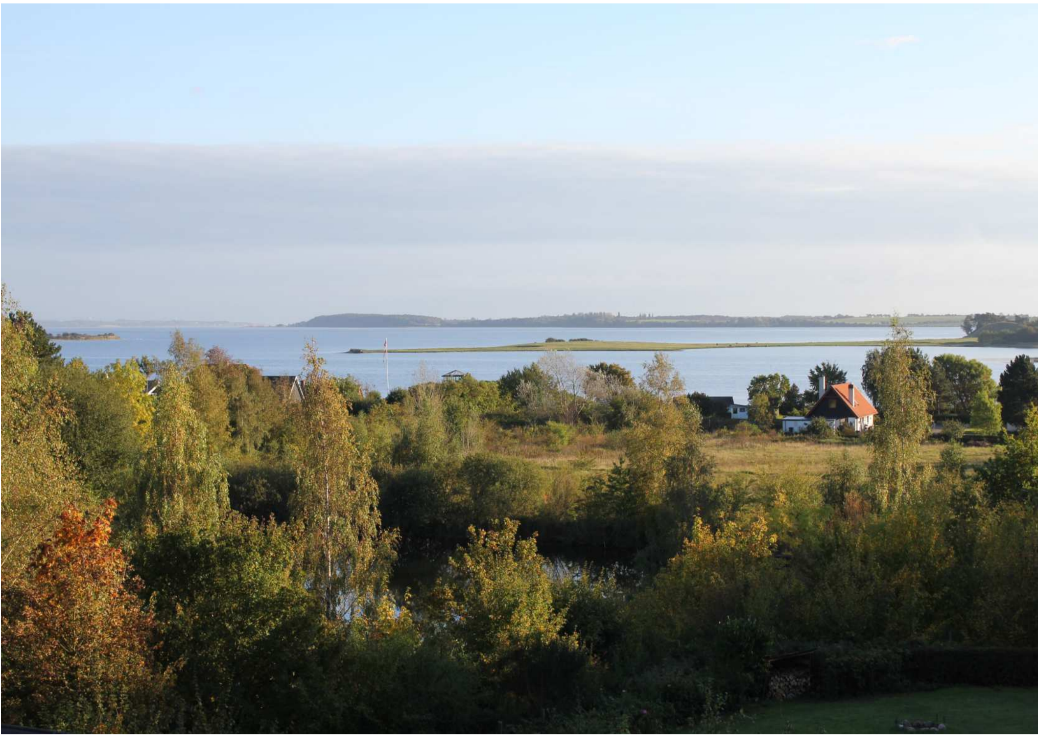
Udsigt over Helnæs Fjord fra Voldbjerg