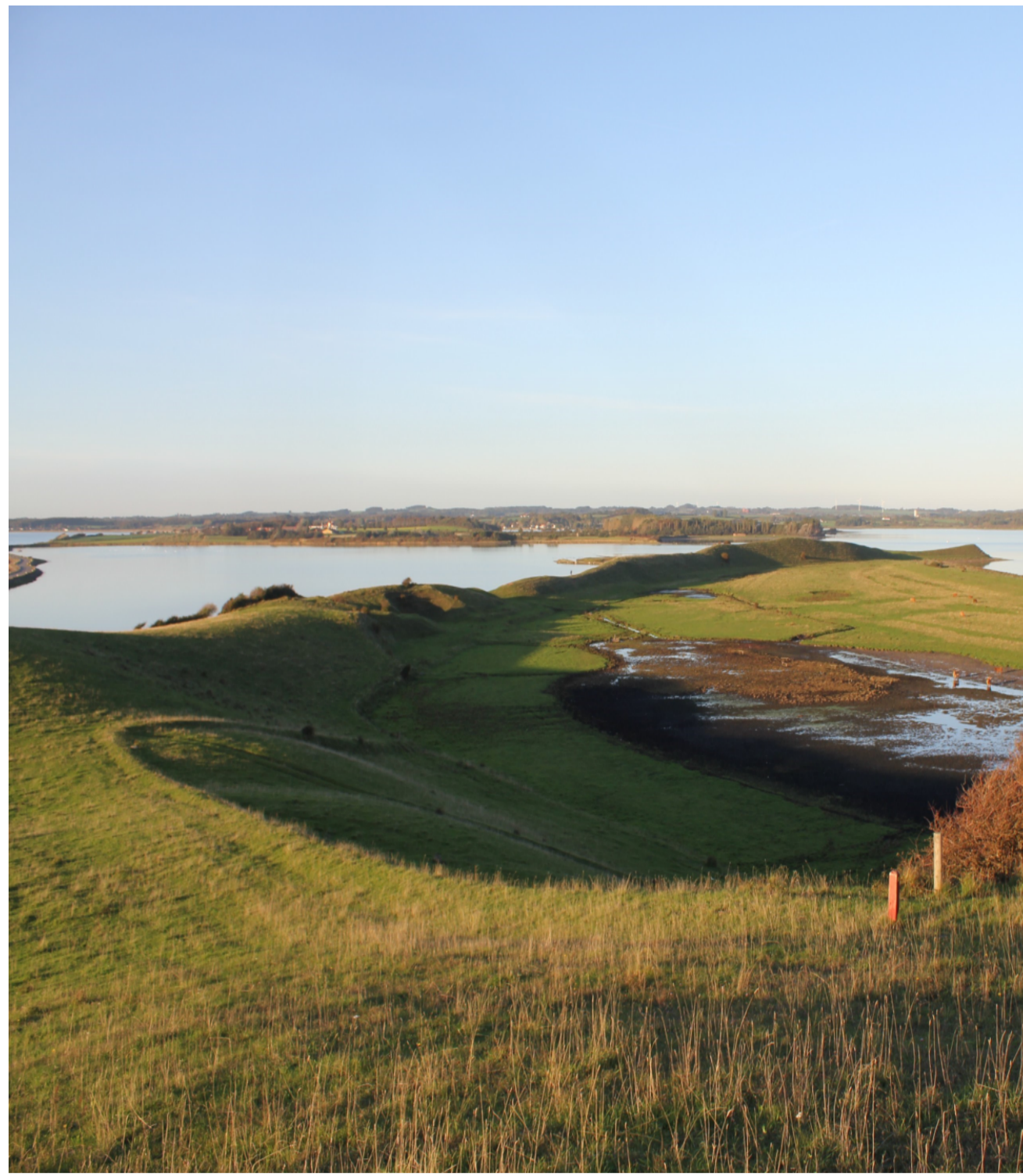
Udsigt over Bo Bakker med ås