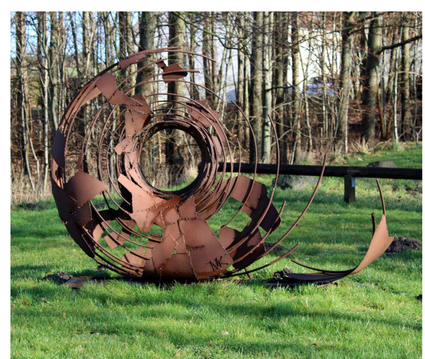
"SUN", Miheala Kamenova 2015.