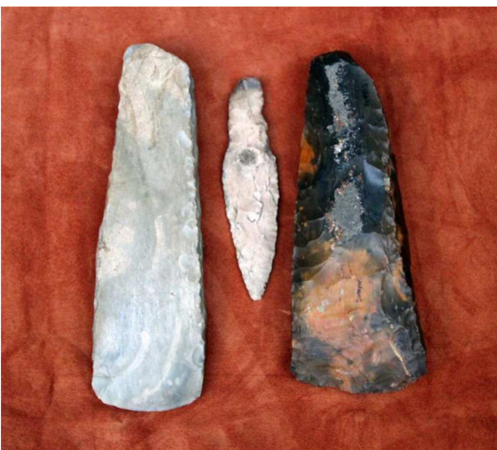
Flinteredsk. yngre stenalder.

Boplads fra ældre stenalder findes i stort tal langs fjordens kyster og kaldes Ærtebøllekultur, men på grund af landsænkningen findes de nu på lavt vand. Derfor ses ofte opskyl af flinteredskaber, som bevidner deres tilstedeværelse.