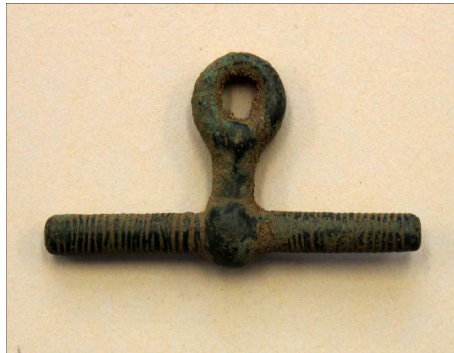
Bronzetrense. Lokalt fund

I yngre bronzealder 1100 – 500 f.kr. lå bopladserne langs Helnæsfjordens kyster med gravhøjene højt i baglandet. De har lidt samme skæbne som stendysserne, så kun få er tilbage. Bronze var det første metal, man lærte at kende. Det blev især brugt til smykker og våben.