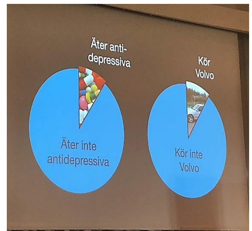
Från "Sjuk, frisk eller mittemellan"