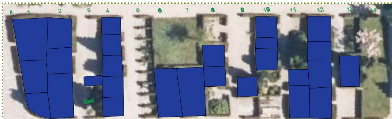
Tidligere gravsteds optegnelser i Brandsoft