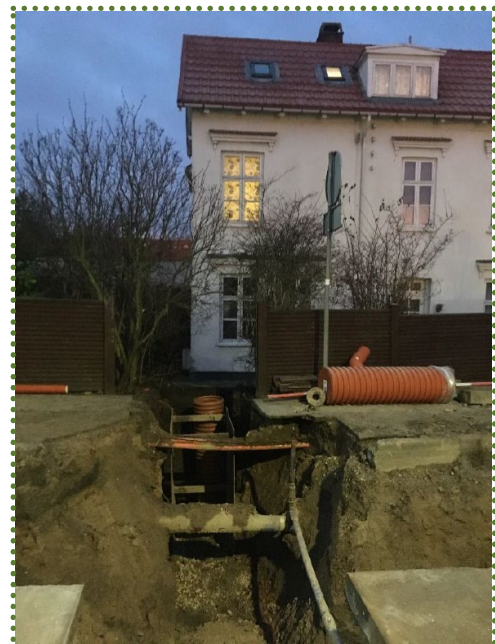
Stik til ejendomme