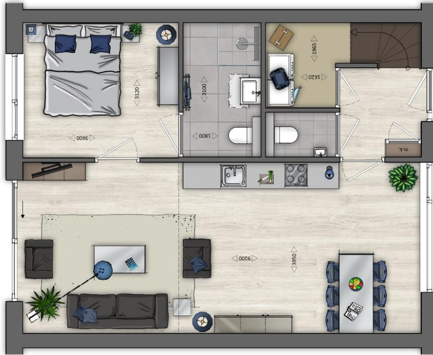
KAVEL 05 - begane grond - schaal 1:50 - A4