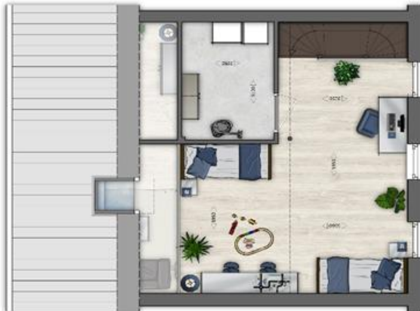
KAVEL 05 - verdieping - schaal 1:50 - A4

Geïnteresseerd? Bezoek onze uitgebreide website www.boserf.nl of neem contact op met Eddy Markovic 06-36531186 / leden@boserf.nl