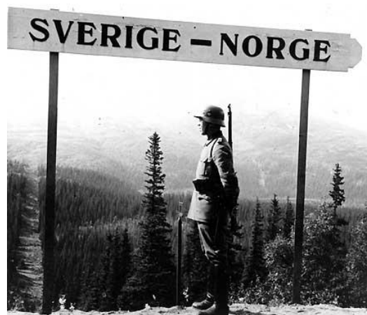
Bild 1: Grängsgatan i norra Gunnarskog, Värmland. Bild 2: Tysk soldat vid gränsen, Storlien Jämtland.