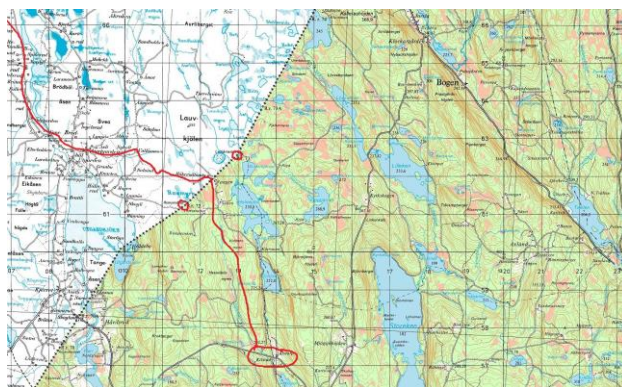
Gränsen, Norge – Sverige vid Håkerudtomta, Austmarka.