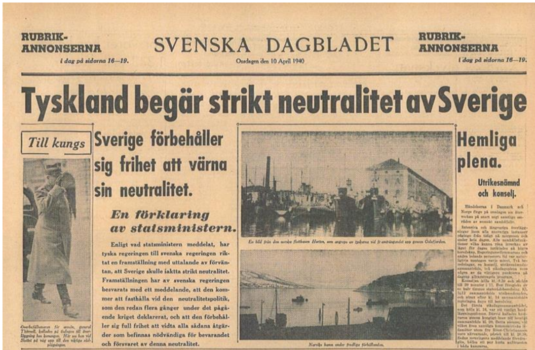
Svenska Dagbladet onsdagen den 10 april 1940.

på morgonen den 9 april ställdes den norske utrikesministern inför det faktum att hans land tagits av främmande makt. Danmark gav upp motståndet i stort sett direkt och därför kunde de danska flygfälten användas vid flygangrepp mot Norge. På Hotell Continental i Oslo låg Vidkun Quisling, ledare för det norska nazistpartiet, Nasjonal Samling (NS) och sov. Innan dagen var slut hade han utsett sig själv till Norges nye statsminister.