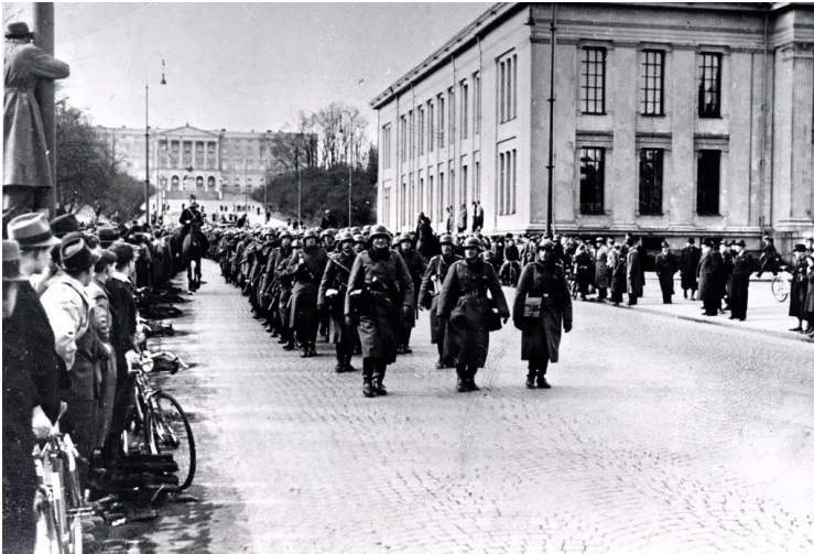
Gunnar Sønsteby ser den 9 april 1940 tyskarna marschera in i Oslo. *Mannen med cykeln till vänster ansågs till en början vara Gunnar Sønsteby, men senare har det kommit fram att det var Erik Gjems-Onstad. Gunnar står mer dold.