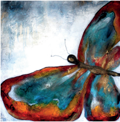
Schmetterling Mixtechnik 100x100cm