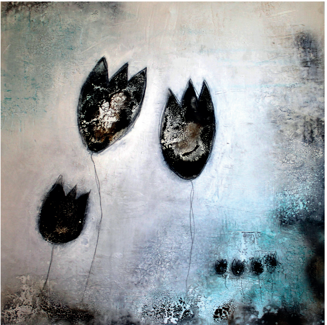
Tulpen Mixtechnik 80x80cm