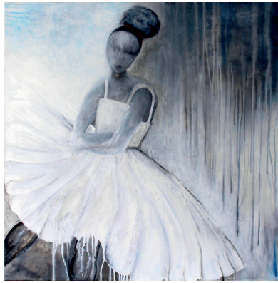
Tänzerin Mixtechnik 100x100cm