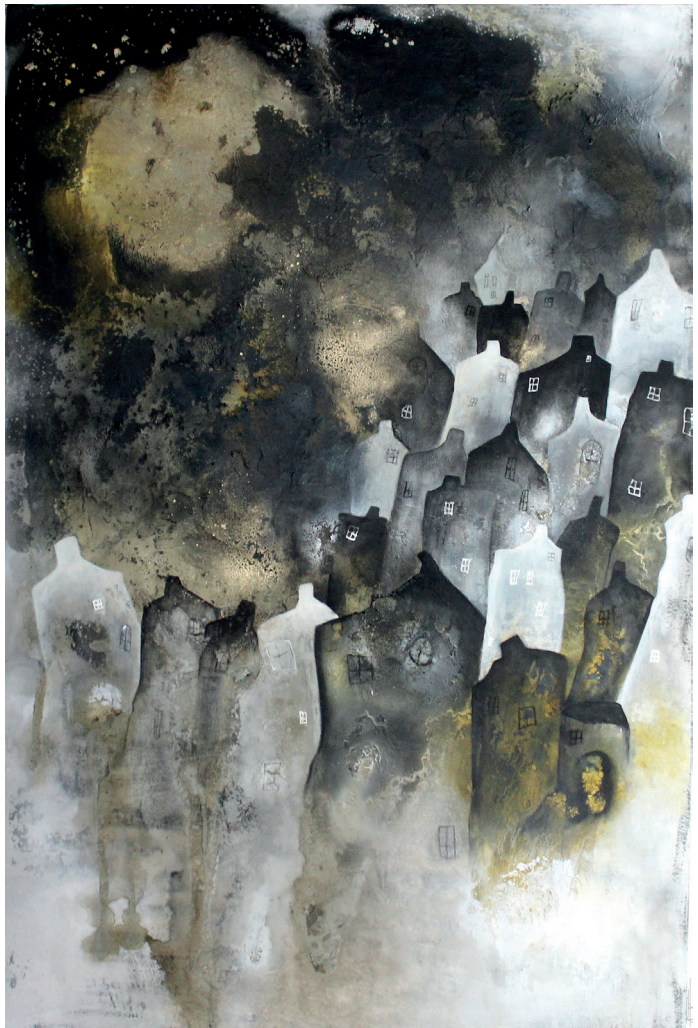
Vollmondnacht Mixtechnik 100x150cm