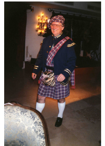
Lors d'un voyage à Londres avec les élèves