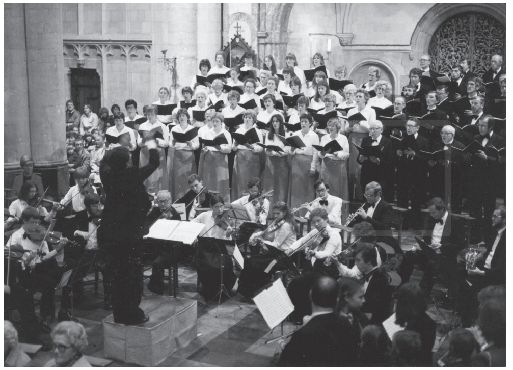
Première de la messe Causa nostra Laetitia - Basilique de Tongres