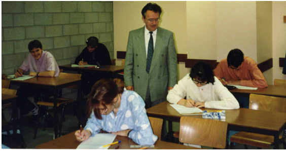
Souvenir juin 1993