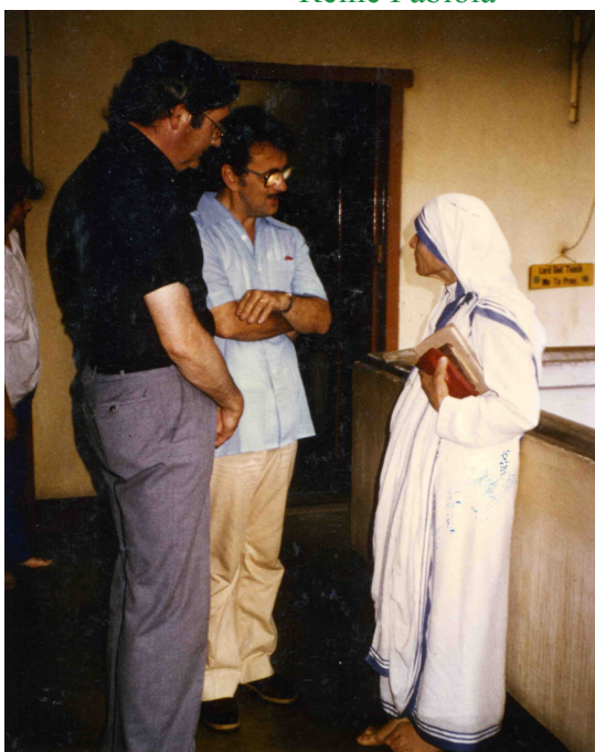
Calcutta Mothier Theresa - Première rencontre après la messe!