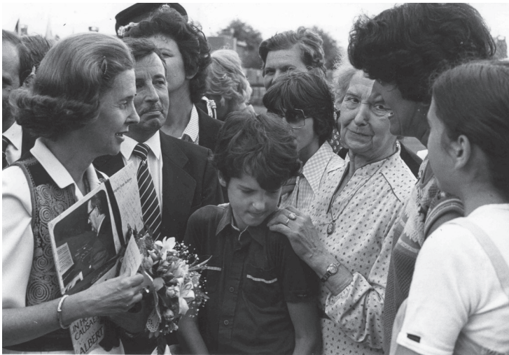
Remise du disque Messe Causa Nostra Laetitiae à la Reine Fabiola