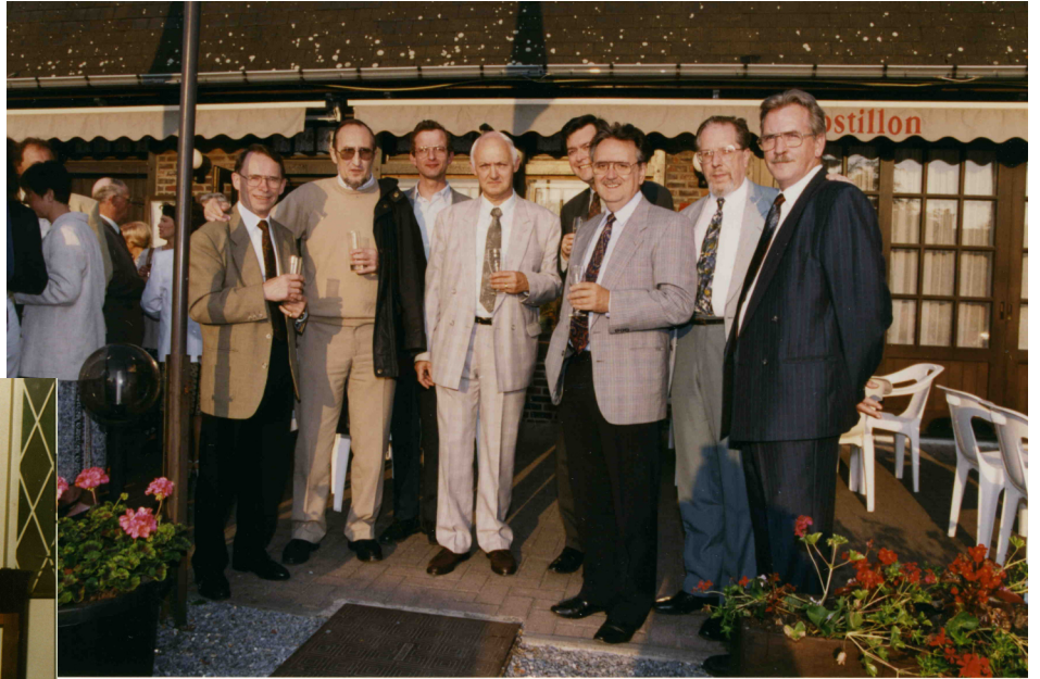
Au Postillon en 1995