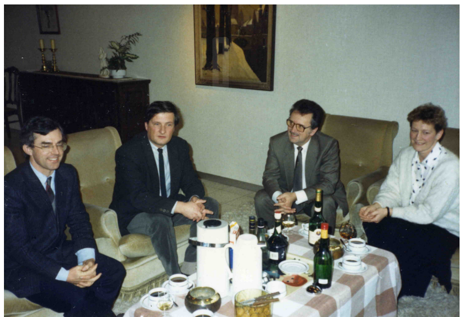
Échanges linguistiques - Brugge 88