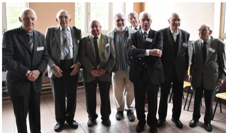
En 2016, 60 ans après la rhéto au collège.