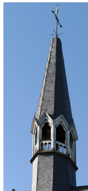
Le clocher tel qu'il était en 2019