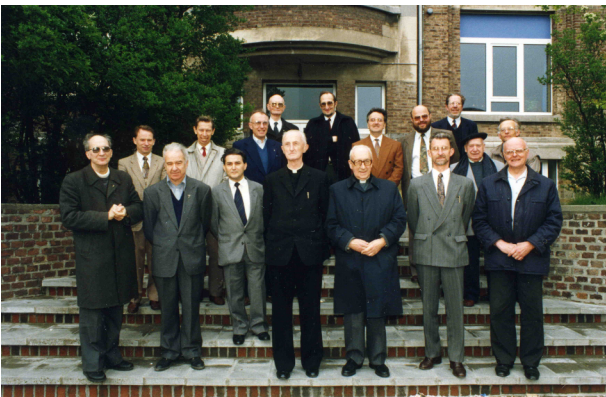
1 er mai 1991