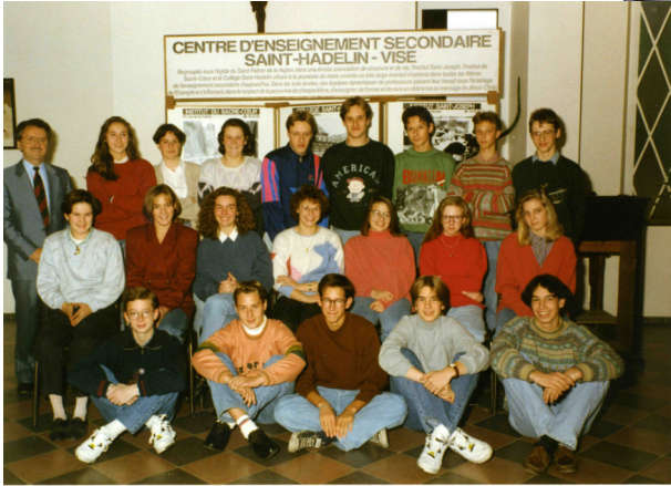
Classe 4F de 91-92