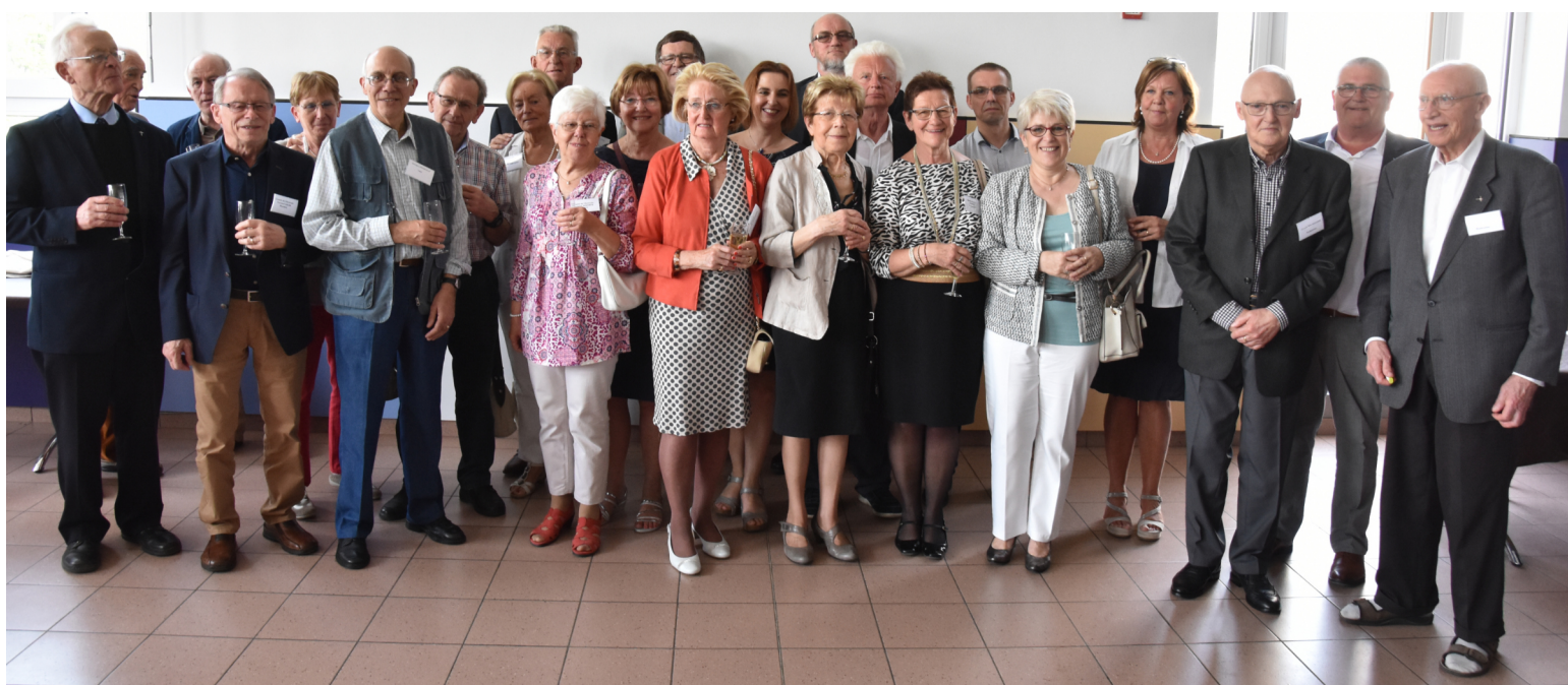
En 2018, anciens élèves dans le corps enseignant ou pensionnés.