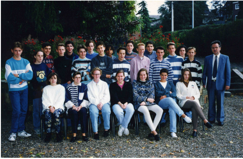
Classe 4A 93-94