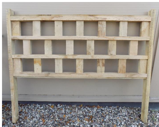
Et modul med tre rækker á 14cm - længde 140cm.