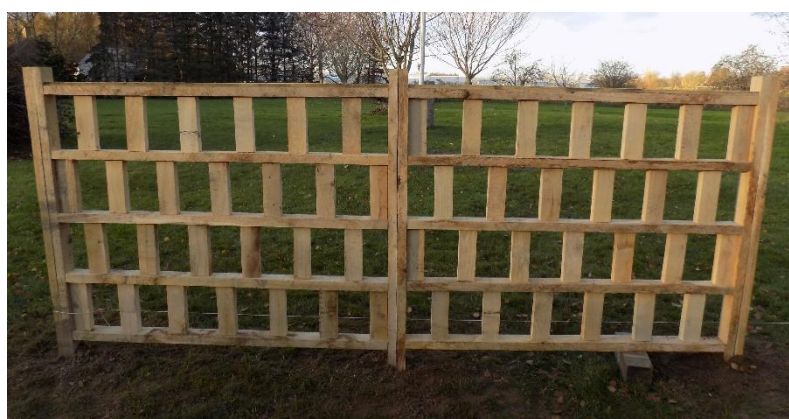
To fag Egeholm med 4 rækker á 21 cm. Højde (monteret) 124 cm

Hegnet fastgøres, så der er 10 cm fra underside til jord.