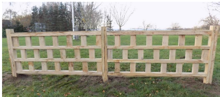
To moduler/fag Egeholm med 3 rækker á 14 cm. Højde (monteret) 70 cm.