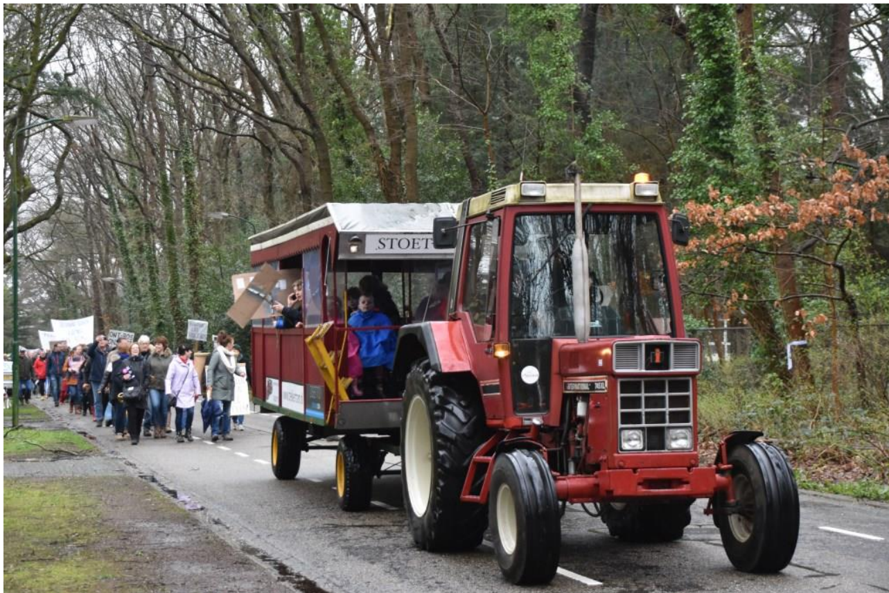
Mars voor behoud Oude Tempel en overhandiging 1.250 handtekeningen aan gedeputeerde

appartementen en in de eerste twee lagen ervan maatschappelijke voorzieningen huisvesten zoals de muziekschool, het Kunstenhuis, de Peppel en de bibliotheek. Dat betekent dat De Punt waarschijnlijk wordt afgebroken en zal worden vervangen door appartementenflats. De markt moet dan ergens anders komen. Vooral het idee om de markt te gaan bebouwen en verkleinen roept vraagtekens op. Hebben we hier niet te maken met een eerder massaal afgewezen plan om de Markt te bebouwen? Ook laat de offerte-uitvraag van het college zien dat Belcour als winkelcentrum in feite wordt afgeschreven. En het vrijhouden van de toegangen tot Belcour vormde juist de onderbouwing voor de verkeersmaatregelen. Lees verder de rubriek .